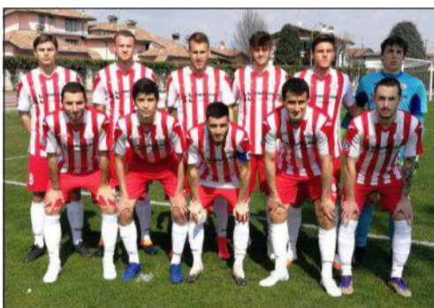
La formazione del Caravaggio

Marku 4: lascia in dieci i suoi dopo 26 minuti per due falli ingenui.