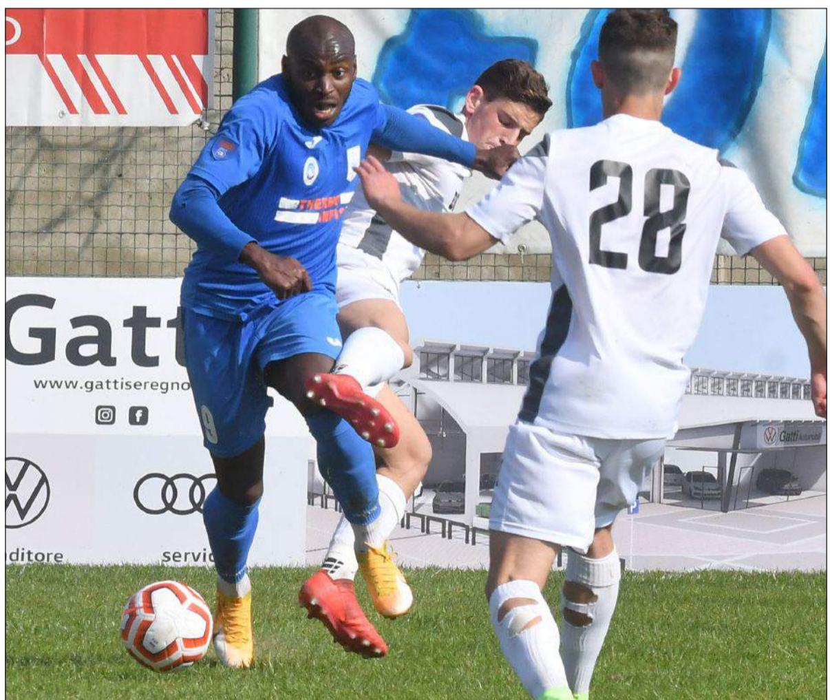
LA GRINTA DI IBE - E il Ponte conquista un punto pesantissimo

SERIE D, GIRONE B Pari a reti bianche in casa della seconda classe. I Blues sognano la salvezza