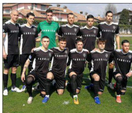
CHI RIDE E CHI PIANGE - Da sinistra Zambelli, la Real Calepina, il Caravaggio e la Tritium Da pagina 2