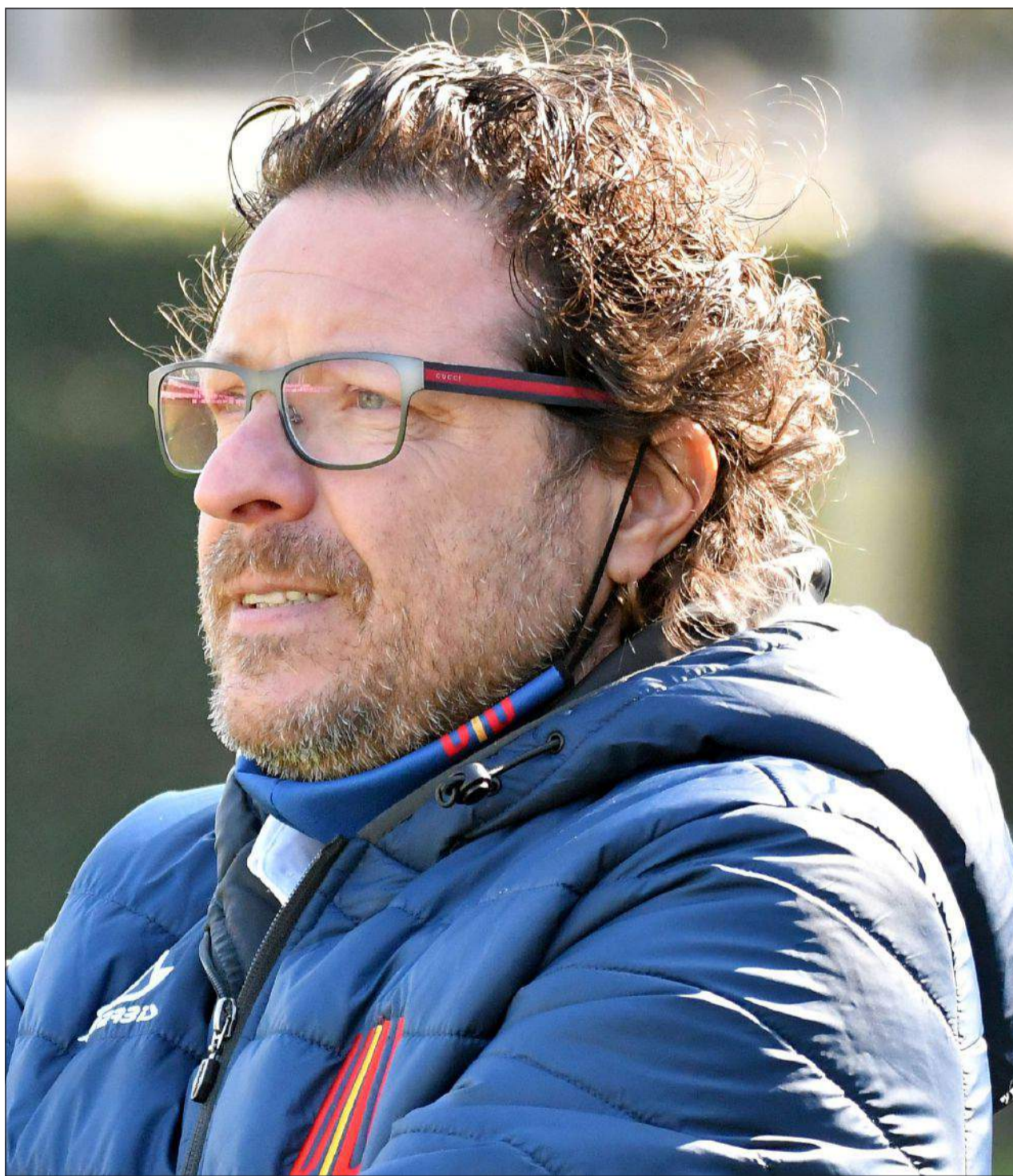
Situazione difficile per il Villa Valle di mister Mussa, sconfitto sabato nell'anticipo dal Sona