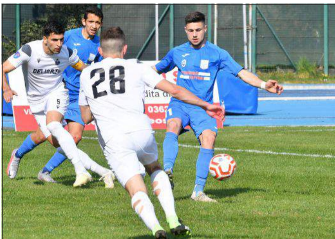
Immagini dalla sfida tra Seregno e Ponte

SEREGNO - Da una parte il Seregno, secondo in classifica nel girone B di Serie D, dall'altra il Ponte San Pietro, coinvolto nella zona calda dei playoff. Il pronostico alla vigilia appare scontato, eppure l'andamento della sfida racconta ben altro. Lo 0-0 conclusivo premia con un punto d'oro gli orobici, risultato giusto per quanto visto in campo con le due rivali che si dividono un tempo per parte. La cronaca. Prima fetta di gara interamente di marca bergamasca: la differenza di punti non sembra farsi sentire e il Ponte fa girare meglio il pallone rispetto ai padroni di casa, pur senza concretizzare la mole di lavoro. I locali faticano a creare occasioni, si segnala solo un tentativo da fermo di Alessandro intorno alla mezz'ora che taglia l'area di rigore provocando un minimo sussulto ai blues. Difesa ospite ben organizzata, tanto che il Seregno appare decisamente più imballato del solito: unico sviazione al 43' quando Ricciardo parte sulla linea del fuorigioco e disegna una traiettoria verso il centro che costringe gli orobici a