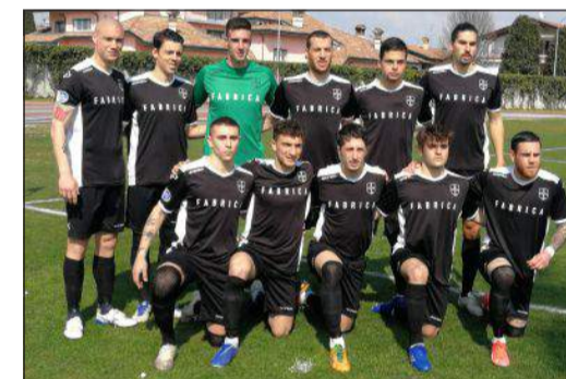
L'undici iniziale della Tritium