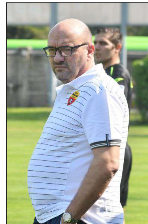
Sopra e sotto alcune immagini della partita