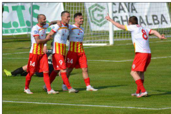
L'esultanza del Villa Valle a Grumello del Monte