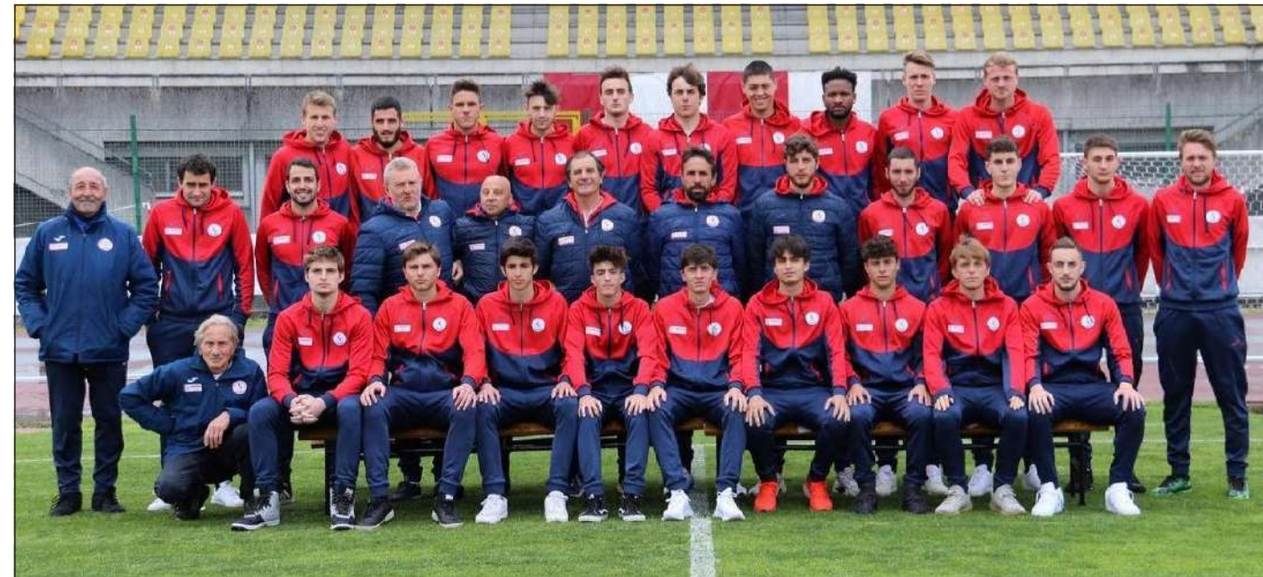
A sinistra il Caravaggio e sotto il Brusaporto