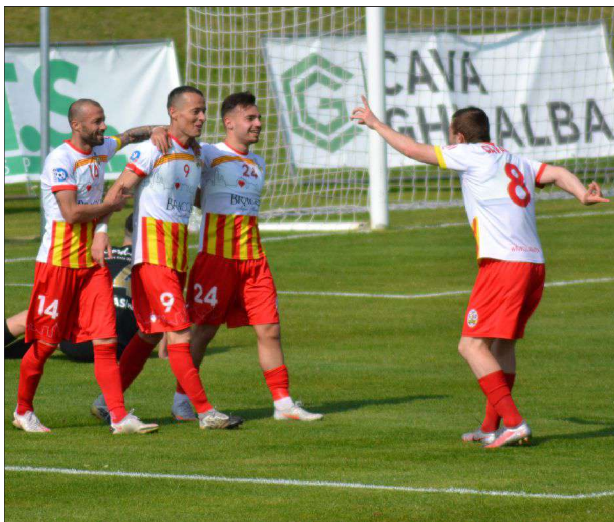
MEGLIO DI COSI' - La festa giallorossa a Grumello

SERIE D, GIRONE B I giallorossi espugnano il campo della Real Calepina e si regalano tre punti pesantissimi