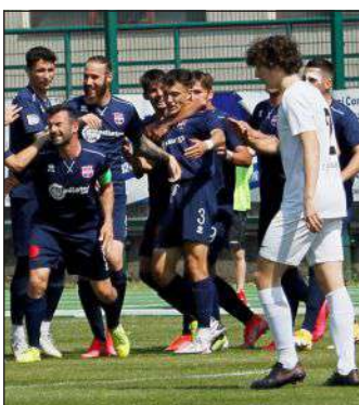
LA DOMENICA SPORTIVA - Immagini dalla giornata delle bergamasche in Serie D