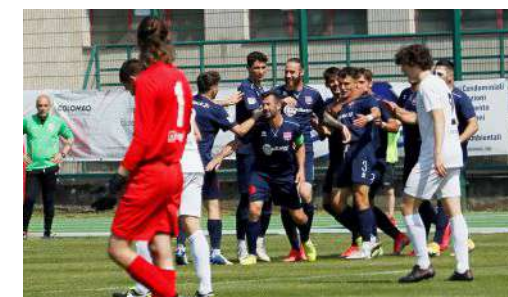
Alcune immagini della gara

in certe situazioni potevamo fare meglio, ma ora i punti sono pesantissimi. La posta in palio è alta, iniziano a pesare i punti, ma anche le gambe: portiamo a casa un risultato importante, abbiamo rischiato sulle palle in profondità. Nella ripresa abbiamo concesso meno e con il 2-0 abbiamo messo la partita al sicuro: per la salvezza non basteranno i 40 punti, almeno 42, c'è ancora da battere a 6 gare dalla fine». Grande protagonista il giovane attaccante 2002