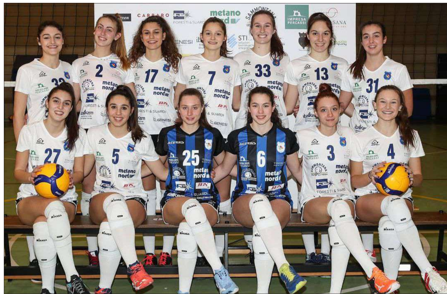
Le ragazze del Chorus Volley Bergamo Academy