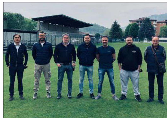
Organigramma societario e tecnico del settore giovanile

dell'AC Monza. Ci si è lasciati dandosi appuntamento a quest'estate, per vivere una settimana di divertimento con il CISA CAMP, ormai pronto ad essere ufficializzato nella sua organizzazione.