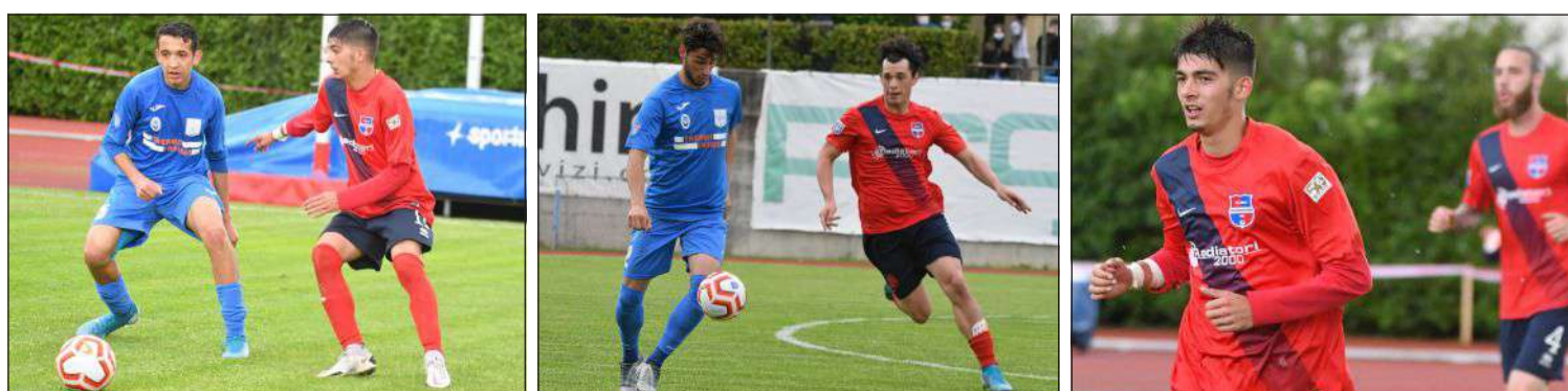
ROSSOBLU' IN STATO DI GRAZIA - Tre immagini da Virtus CiseranoBergamo-Ponte

SERIE D GIRONE B Vittoria importantissima e di prestigio nel derby col Ponte