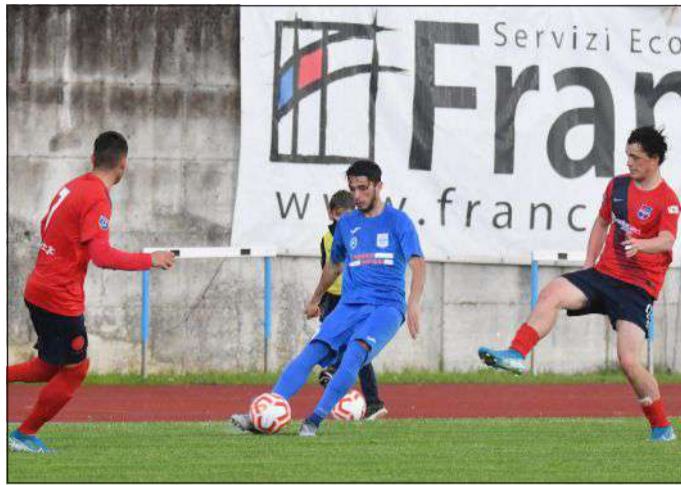
Tre immagini del derbississimo di ieri tra Virtus CiseranoBergamo e Ponte San Pietro