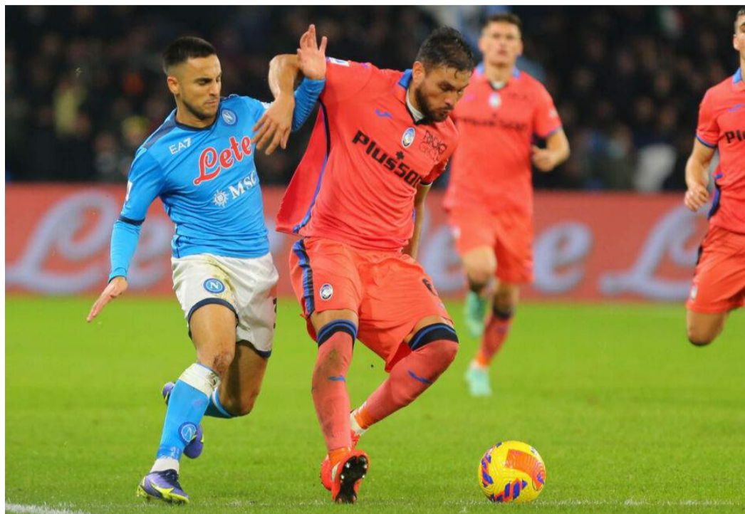
Ounas e Palomino durante la sfida d'andata giocata al San Paolo

GLI AVVERSARI Spalletti deve rinunciare a Rrahmani, Di Lorenzo e Osimhen. Mertens titolare