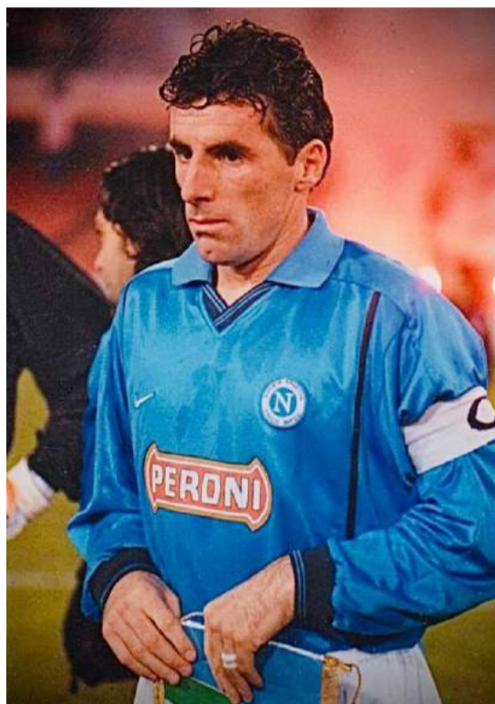
L'esperienza a Napoli