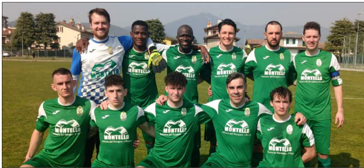
Un recente undici della Nova Montello, impegnata nella lotta salvezza del girone B di Seconda Categoria