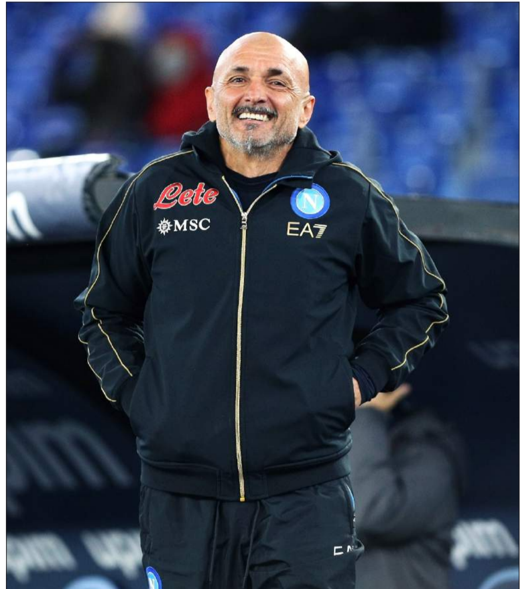
Luciano Spalletti, allenatore del Napoli