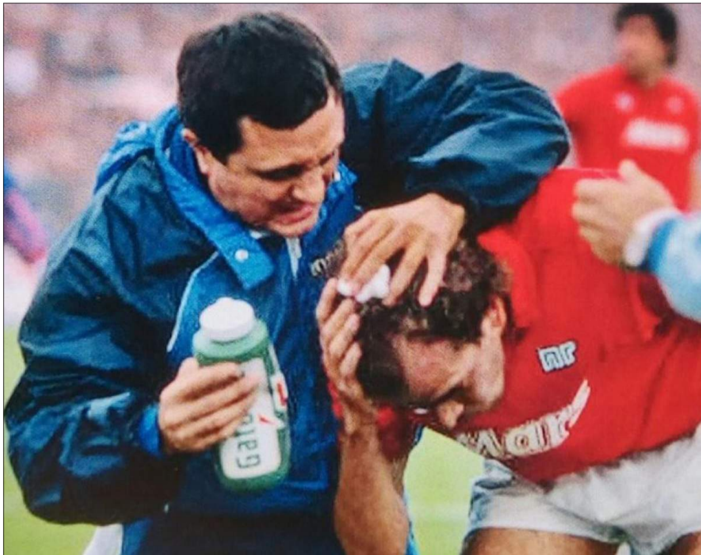
Il famoso episodio della monetina durante Atalanta-Napoli

Quell'episodio della "monetina" in testa ad Alemão fu, quindi, determinante per assegnare la vittoria a tavolino al Napoli (2-0) sulla Dea e deci-