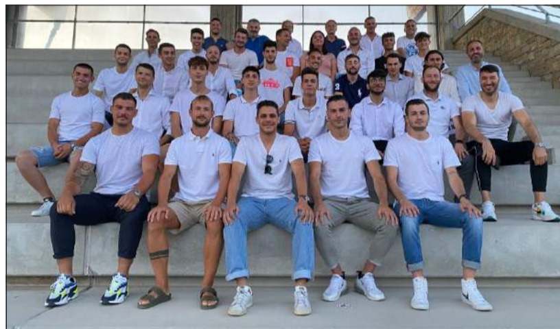
La rosa dell'Atletico Villongo, impegnato nel girone F di Prima Categoria