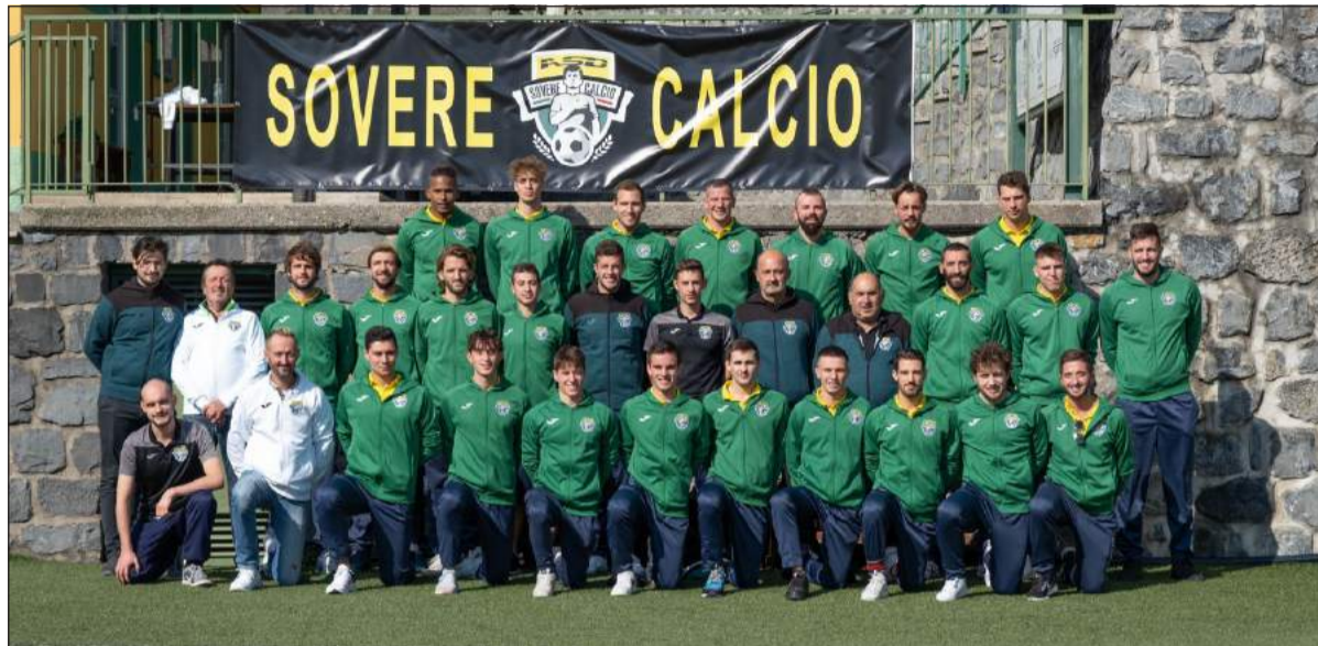
La rosa del Sovere, impegnato nel girone F di Prima Categoria