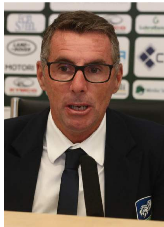
Direttore sportivo della Feralpi Salò