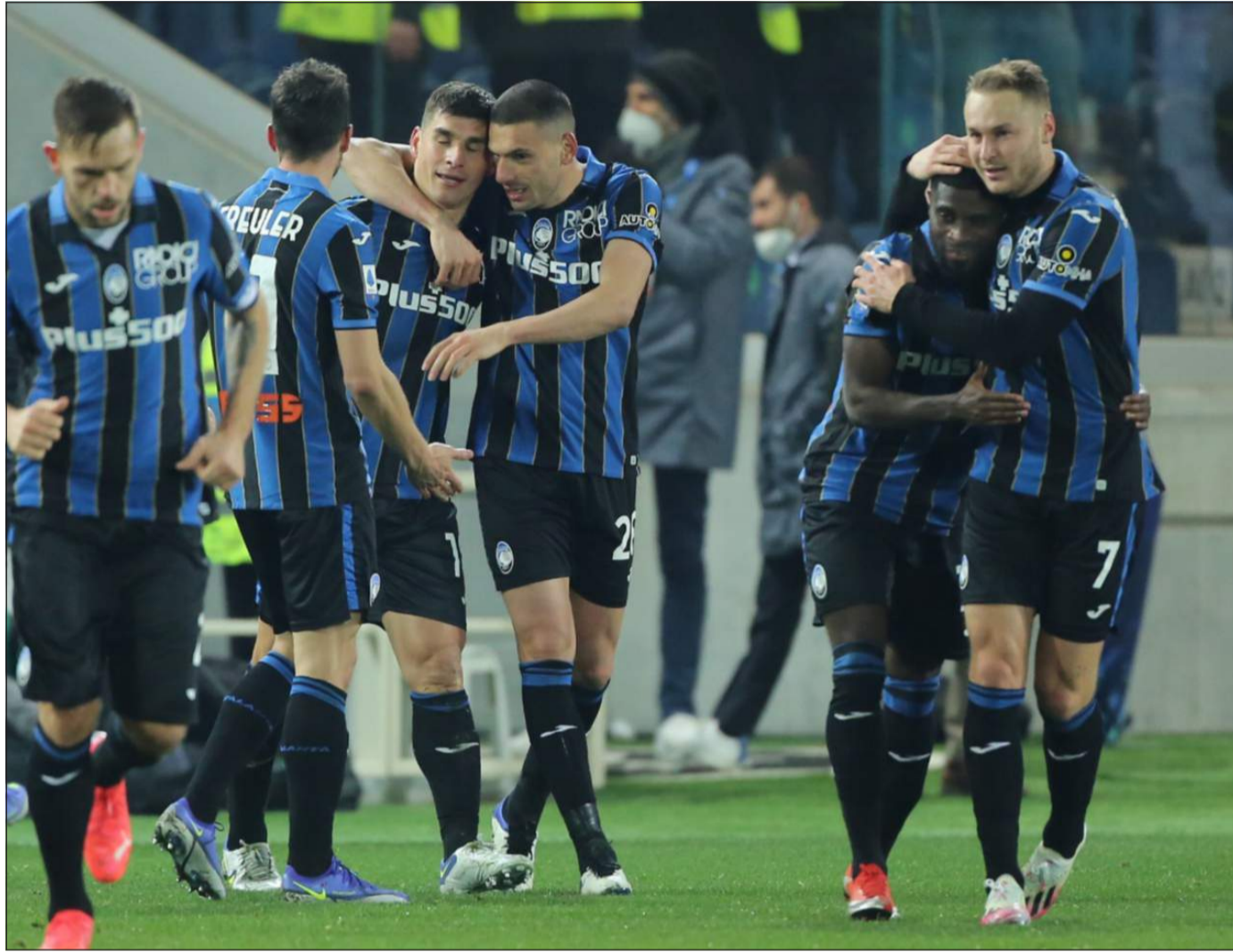
Festa atalantina dopo un gol segnato alla Juventus

Atalanta-Napoli, un happening di calcio spettacolare, bel gioco, gol e intuizioni tattiche innovative. Così il vaticinio di esperti, cronisti e opinionisti vari mentre per il popolo nerazzurro, da una parte, e i tifosi partenopei, dall'altra, interessa solamente la vittoria dei loro beniamini. Atalanta-Napoli dà il via all'ultimo e decisivo sprint del campionato quando mancano otto partite otto al termine, nove per i nerazzurri e mercoledì 13 l'udienza al Collegio di Garanzia anche se la Lega ha fissato per l'11 maggio o il 27 aprile, in caso di eliminazione in Europa League, il match di recupero col Torino. Nerazzurri in lizza, almeno, per un posto in Europa, sperando ancora nella Champions, non si sa mai, Napoli in lotta per uno scudetto che alle falde del Vesuvio manca da trentadue anni. Immaginiamo gli scongiuri al Caffè Gambrinus e oltre. L'Atalanta ha anche altri pensieri per la testa: giovedì il turno d'andata dei quarti di Europa League a Lipsia ma sappiamo che Gasperini, in generale, pensa e prepara partita per partita senza ulteriori. Eppure qualche considerazione ha valore perché il quarto posto sembra ormai lontano, anche se il distacco è di cinque punti virtuali, e dietro Roma, Lazio e Fiorentina inseguono, quindi l'Europa League resta un'opportunità di grande valore. E' un periodo di stagione quando si cominciano a fare calcoli per il futuro, come essere davanti ad un bivio dove è opportuno imboccare la via migliore che