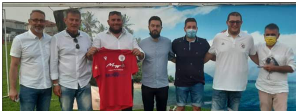
La dirigenza della Pagazzanese