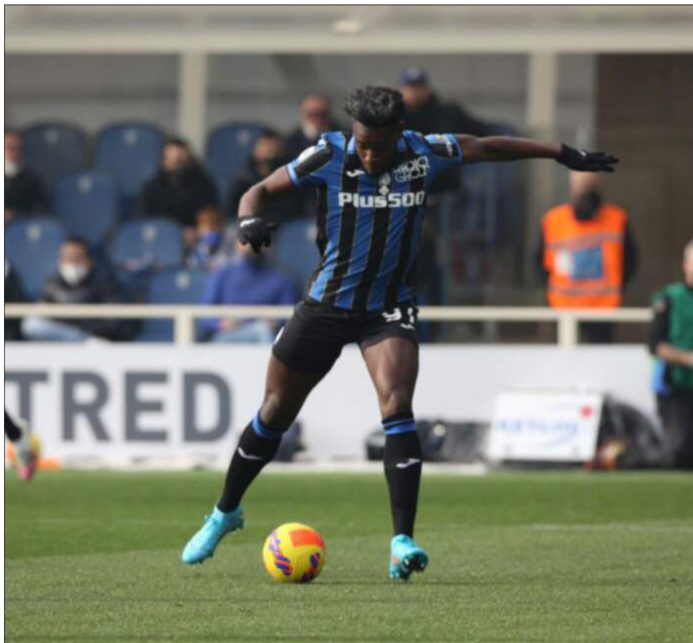
Duvan Zapata in azione contro il Cagliari lo scorso 6 febbraio