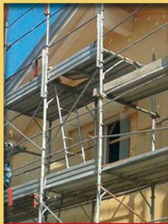
RIVESTIMENTO A CAPPOTTO