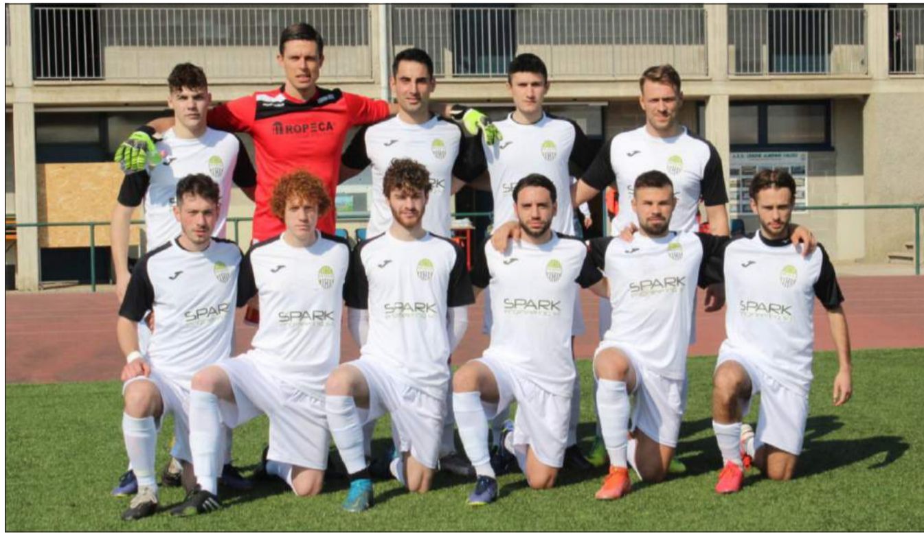
Una recente formazione del Lemine Almenno, impegnato nel girone B di Eccellenza