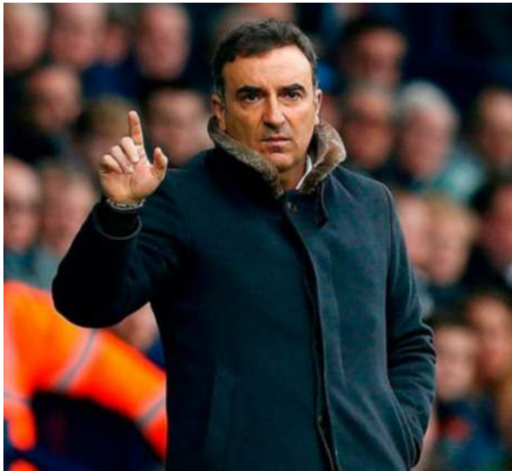
Carlos Carvalho, allenatore dei portoghesi del Braga