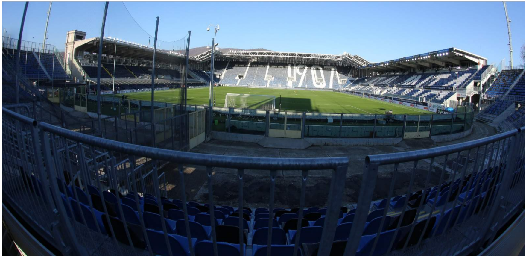
Una panoramica del Gewiss Stadium desolatamente vuoto lo scorso 6 gennaio, quando doveva giocarsi la sfida tra Atalanta e Torino

Deciderà, infatti, l'esito dell'eliminazione europea contro i tedeschi del Lipsia, in calendario i prossimi 7 e 14 aprile con ritorno sotto la Maresana. Le semifinali continentali sarebbero il 28 aprile e il 5 maggio, il 18 l'atto conclusivo a Siviglia. La data, in caso di eliminazione, sarà anticipata al 20 o al 27 aprile. Nel primo caso ci sarebbe la coincidenza con Juventus-Fiorentina, semifinale di ritorno del trofeo della coccarda, e con la diciannovesima giornata alla Dacia Arena, Udinese-Salernitana. Nel secondo, invece, con Fiorentina-Udinese, Bologna-Inter (entrambe anche su Sky) e Salernitana-Venezia.