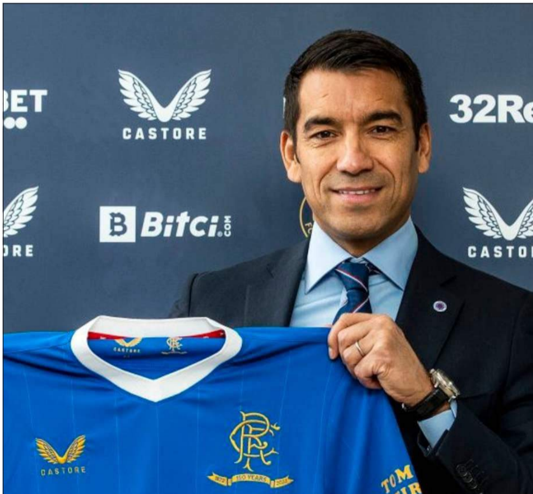
Giovanni Van Bronckhorst ha sostituito Gerrard sulla panchina dei Rangers di Glasgow