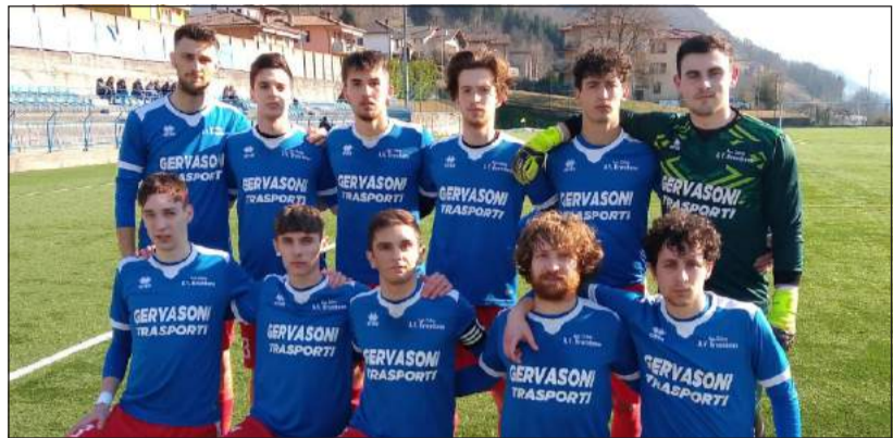
Un undici dell'Accademia Alta Val Brembana