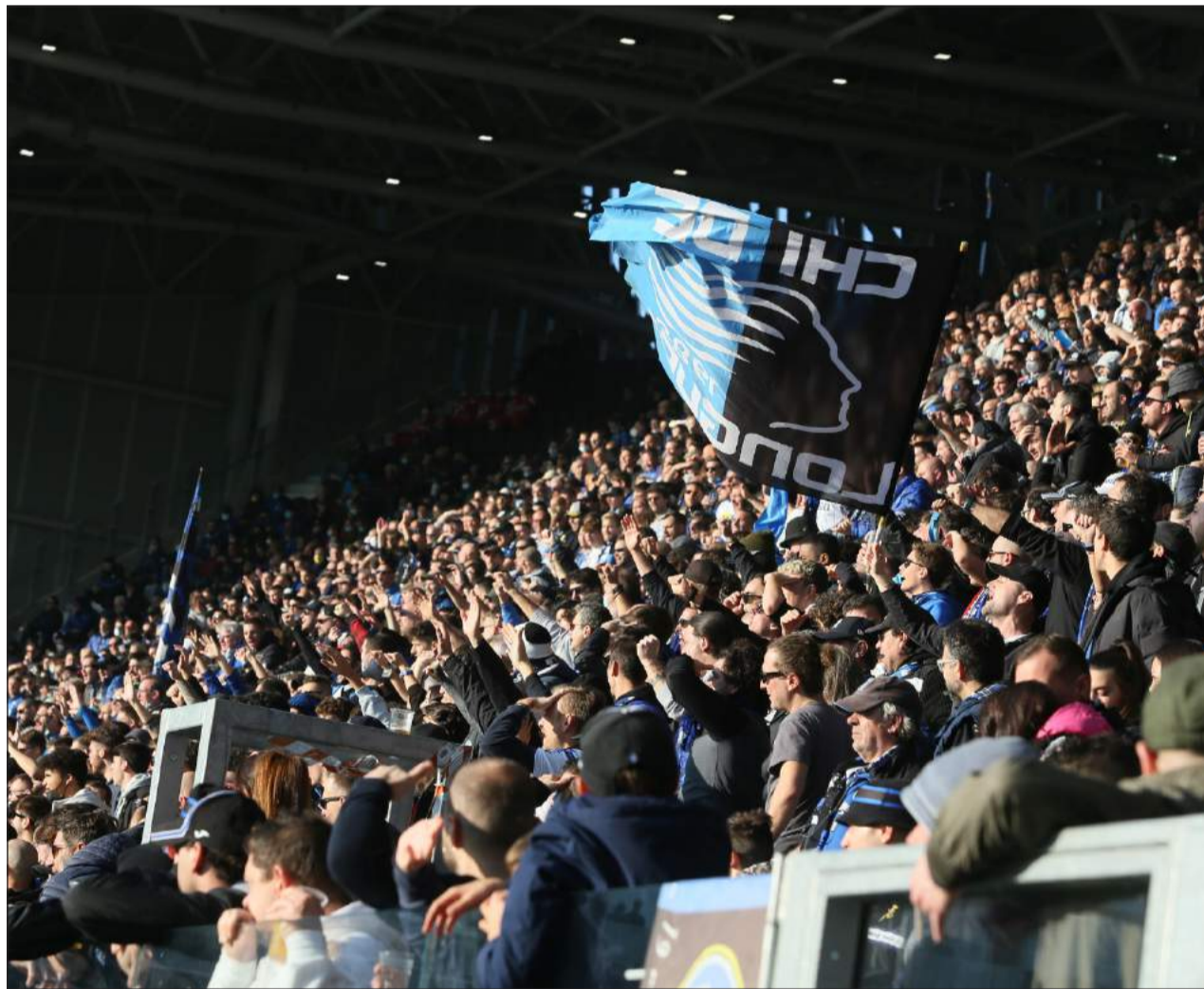
Gewiss Stadium delle grandi occasioni per Atalanta-Napoli. La capienza torna al 100% e la tifoseria bergamasca ha risposto presente. Intanto Zapata viene convocato a sorpresa. Napoli senza l'infortunato Di Lorenzo e gli squalificati Osimhen e Rrahmani

LA PARTITA Arriva il Napoli in lotta per lo scudetto e l'infermeria finalmente si svuota