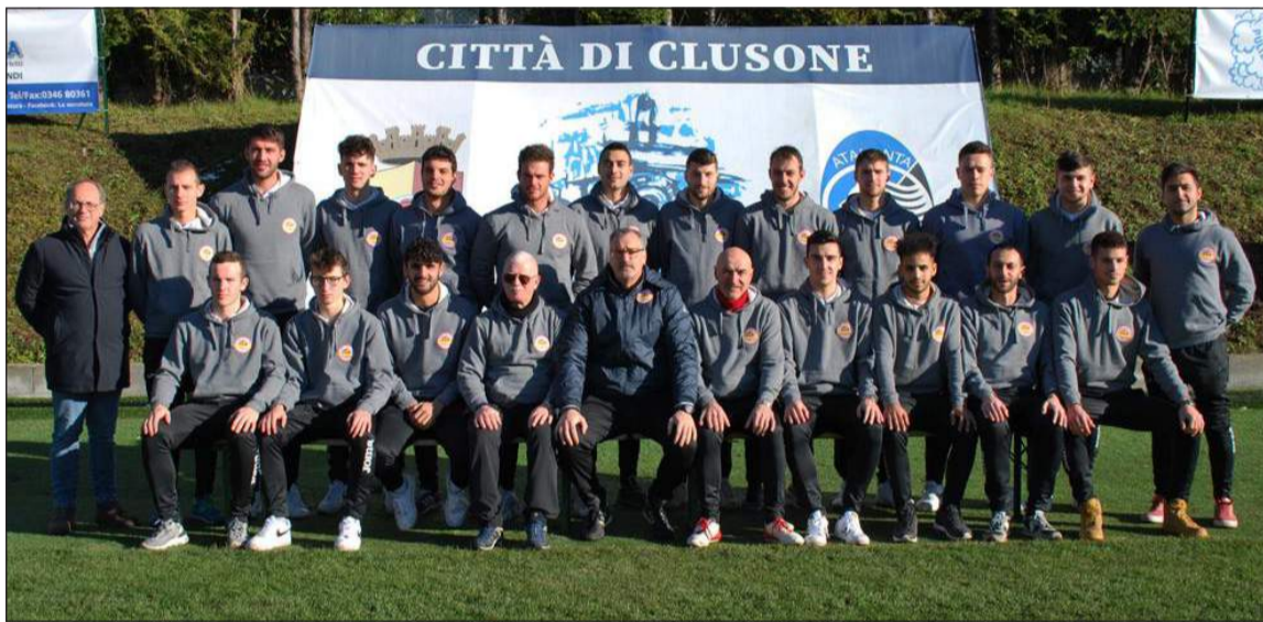
La rosa del Città di Clusone, impegnato nel girone B di Terza Categoria