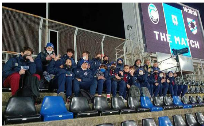
I ragazzi del settore giovanile al Gewiss Stadium per Atalanta-Sampdoria

GOsped di Capriate San Gervasio, azienda leader nel settore trasporti e spedizioni. Cosa signi-