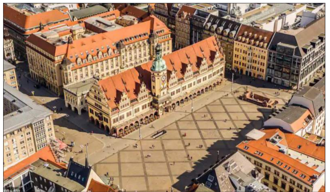
Il centro storico di Lipsia e, a sinistra, uno scorcio della Red Bull Arena

La Sassonia autentica, tra Sacro Romano Impero, Mitteleuropa e DDR. Lipsia, Leibz'sch in alto sassone, è la città più grande del Land con 600 mila residenti in 297 chilometri quadrati, a 113 metri, alla confluenza di Pleisse, Weisse Elster e Parthe, un centinaio di chilometri dal capoluogo Dresda, 160 da Berlino e 195 da Praga. Suddivisa in dieci Stadtbezirke, comprendenti 63 Ortsteile (quartieri), ha nel Monarchenhügel (159 metri) la vetta naturale, mentre il Fockeberg (153) è una collina di macerie del secondo conflitto. Una delle tre sedi della Biblioteca nazionale tedesca, è snodo principale della S-Bahn della Germania Centrale, servito dall'aeroporto di Lipsia-Halle. Il simbolo cittadino è il Völkerschlachtdenkmal, il Monumento alla Battaglia delle Nazioni, edificato nel centenario della disfatta napoleonica (16-19 ottobre 1813) ad opera della Sesta Coalizione di Russia, Prussia, Austria e Svezia: 91 metri, 500 gradini e piattaforma panoramica. La Sassonia, stato satellite francese dal 1806 nella Confederazione