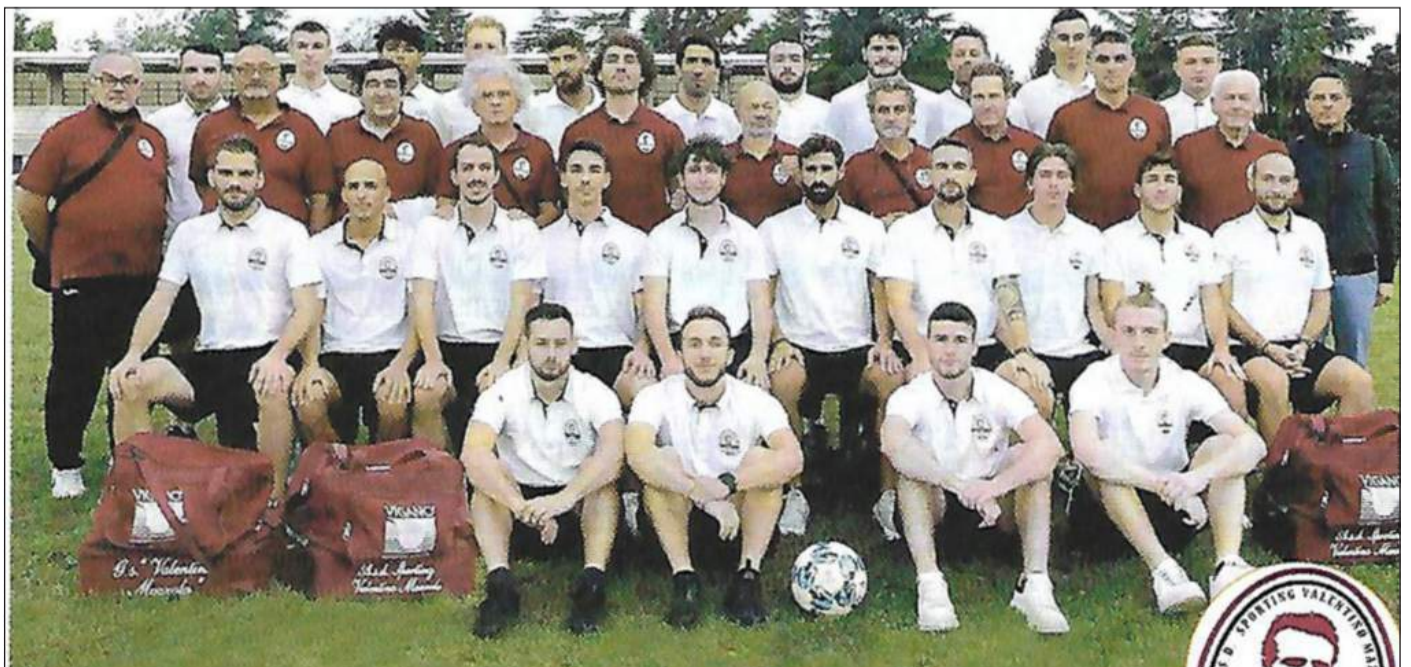
La rosa dello Sporting Valentino Mazzola, impegnata nel girone L di Prima Categoria