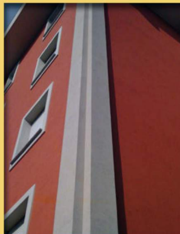
ISOLAMENTO A CAPPOTTO