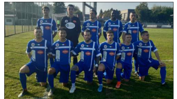
Un undici della Pagazzanese