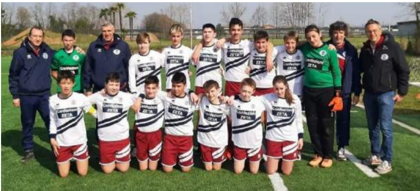
L'Under 12 che ha affrontato l'Atalanta