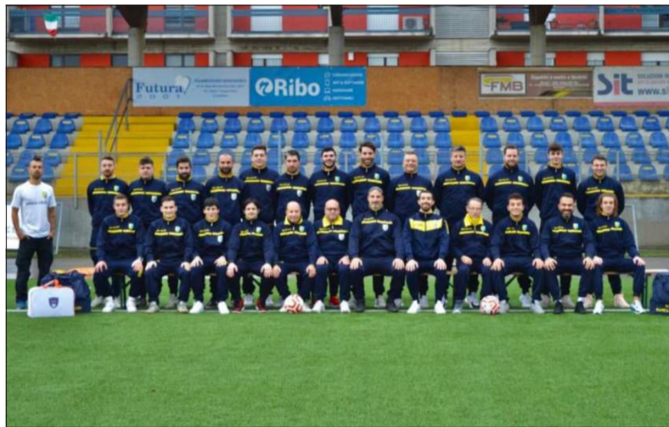
La rosa del Ranica, impegnato nel girone B di Terza Categoria