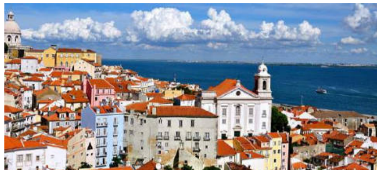
Uno scorcio di Lisbona