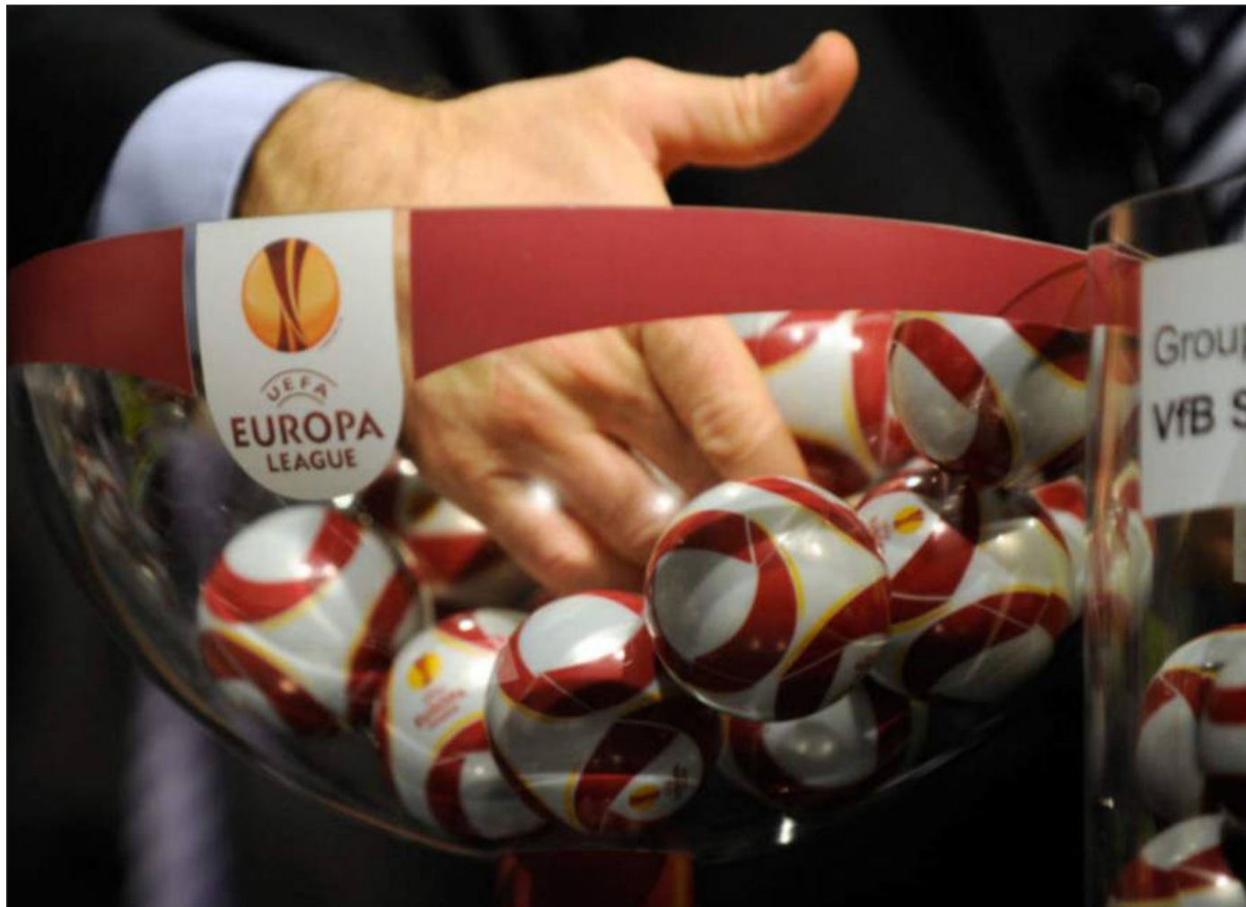
Sporting Lisbona, Sturm Graz e Rakow Czestochowa le avversarie dei nerazzurri in Europa