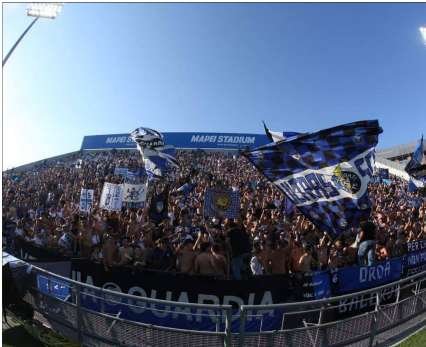
La tifoseria nerazzurra in trasferta al Mapei Stadium contro il Sassuolo

Atalanta-Monza per capire di più, sia futuro che prospettive immediate a pochi giorni dal ritorno in Europa. Una partita poche ore dopo la conclusione del calciomercato e alla vigilia della prima sosta internazionale. Una sconfitta, soprattutto all'inizio di campionato, non è una catastrofe né la fine dei sogni di gloria semplicemente un inciampo imprevisto, appunto come il 2-1 di Frosinone. Adesso per rimediare ecco il confronto con la formazione brianzola, che nella scorsa stagione lasciò sei punti ai nostri beniamini, e si presenta l'occasione per festeggiare il ritorno a casa in uno stadio che è un cantiere, per l'intera stagione, e sarà al completo perché dopo due trasferte il popolo nerazzurro vuole vedere all'opera l'Atalanta. I nerazzurri, quindi, hanno l'opportunità di tornare al successo per esaltare i loro tifosi e riscattare l'inopinato passo falso in Ciociaria. Anche con i nuovi arrivi la Dea ha mantenuto intatta la sua identità tattica mentre tecnicamente sembra aver compiuto un passo avanti. Gasperini, si sa, da sempre predilige il gioco offensivo e vuole a disposizione un attacco con giocatori duttili ma soprattutto veloci e agili, in grado di saltare l'avversario. Non è un caso che da quando è alla guida dei nerazzurri il reparto offensivo è stato tra i più forti del campionato, spesso il più prolifico. Non c'è più Zapata, passato al Torino, pochi giorni prima a Frosinone aveva raggiunto quota 91 gol segnati con la maglia nerazzur-