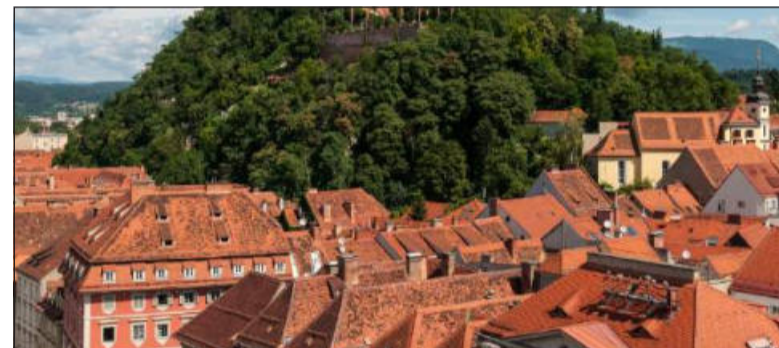
Un'immagine di Graz. In alto, Czestochowa