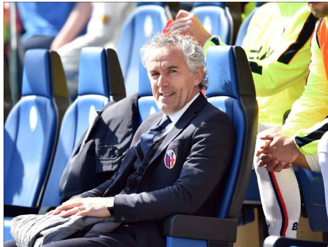
Roberto Donadoni, candidato alla guida della nazionale femminile

In maglia atalantina, quella che lo ha visto crescere e poi sbocciare definitivamente, ha disputato cinque stagioni dalla "famigerata" Serie C dell'81 (con ritorno immediato nella serie cadetta), passando per la B e la bellissima promozione in A dell'84 con tecnico il "Sor Nedo" Sonetti. La fortissima ala bergamasca riesce, quindi, a debuttare in Serie A con la maglia nerazzurra concludendo alla grande il proprio percorso di formazione con due annate nella massima serie. Le