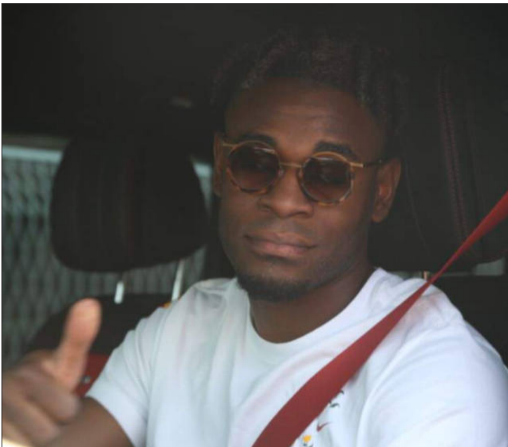
Duvan Zapata è un nuovo giocatore del Torino

Da capocannoniere al primo girato di corsa, 28 di cui 23 in campionato nel 2018-2019, l'unico privo di infortuni seri, al 2+1 tra il 2022-2023 da remi in barca e la fine estate dell'addio annunciato. Romanista mancato, torinista azzeccato. Ma c'è da scommettere che il nerazzurro continuerà a fasciargli il cuore, scrostandosi dalla pelle solo a fatica. E pazienza se il secondo caso su due della finestra estiva s'è chiuso addosso con tutto lo spigolo a una grande storia che meritava una fine più gloriosa, non certo da merce di scambio rimasta tale sulla carta. Perché Duvan Zapata, il più prolifico bomber in serie A dell'Atalanta a quota 69 gol appaiando Cristiano Doni nel ko a Frosinone, è stato tanto generoso da aver inteso rendere un ultimo servizio alla causa da contropartita tecnica, espressione disumanizzante se mai ce n'è una, finendo per essere trattato da trasferimento in sé e per sé causa voltafaccia del Re Tentenna più famoso della capitale subalpina dopo Carlo Alberto, il sovrano della difesa Alessandro Buongiorno. Da aspirante imperatore a eterno monsignor Travet allevato a latte e Filadelfia.