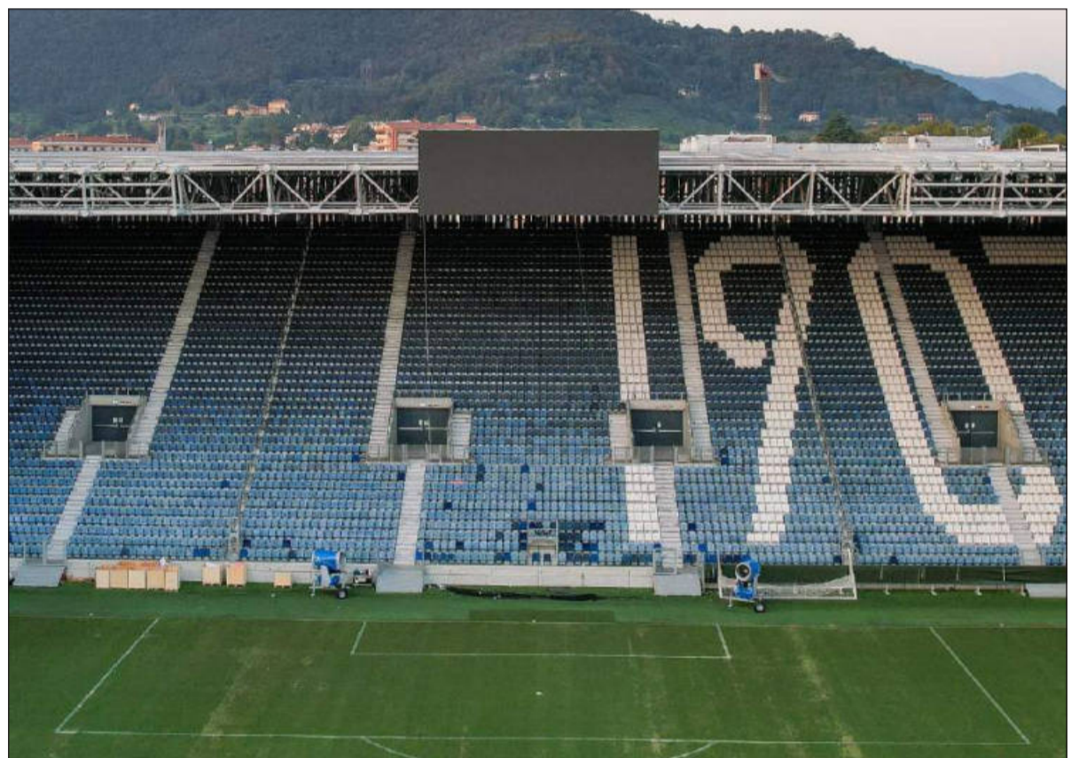
MDC Il nuovo tabellone installato in Curva Nord

to. Per quanto riguarda il settore Distinti Sud, va fatta una doverosa precisazione: tale spicchio di stadio verrà demolito soltanto in un secondo momento e nella stagione 2023/24 verrà impiegato per ospitare i tifosi ospiti che giungeranno al Gewiss al seguito delle proprie squadre. Le tempistiche? La conclusione dei lavori è prevista per la fine dell'estate 2024 e di conseguenza l'Atalanta sarà costretta a disputare l'intera stagione 2023/2024 senza una fetta importante del proprio tifo: per la precisione ad ogni partita della Dea ci saranno circa 3500 tifosi in meno rispetto agli standard abituali. Ma a partire dal campionato 2024/25 ogni tassello ritroverà la sua naturale collocazione grazie alla conclusione dei lavori di restyling. L'Atalanta e tutti i suoi sostenitori potranno godere di uno stadio finalmente al completo e ultimato in tutte le sue peculiarità e novità. Un catino da 25 mila persone pronto a fare da cornice alle prossime imprese dei nerazzurri, in campo nazionale e non solo. Tra le ultime e fresche novità, inoltre, va segnalata l'installazione del nuovo tabellone luminoso di ultima generazione che è stato posizionato sopra la Curva Pisani. Una volta completati i lavori della Curva Sud, avverrà l'impianto di un secondo ledwall proprio sopra di essa. Il tutto per un Gewiss Stadium sempre più all'avanguardia.