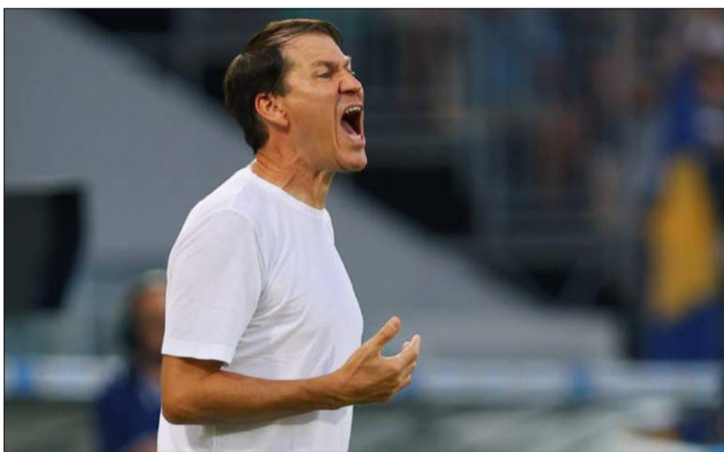
Rudi Garcia, nuovo allenatore del Napoli fresco di scudetto