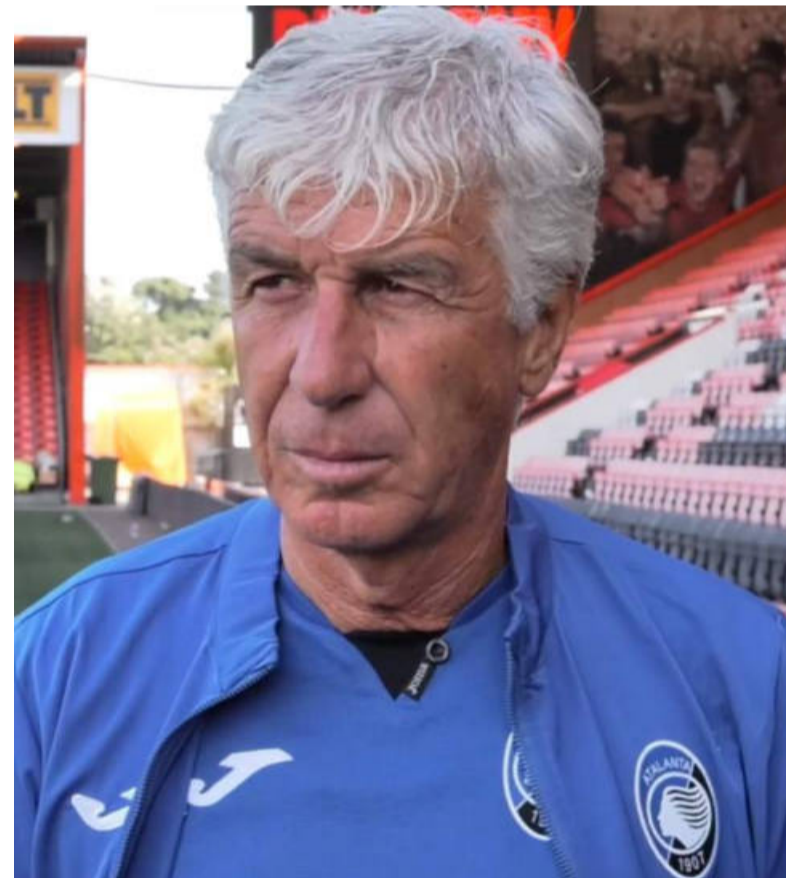
Gian Piero Gasperini, ottava stagione alla guida della Dea

nante e molto difficile. Lo Sporting Lisbona ha fatto vedere cose importanti anche l'anno scorso in Champions - la chiosa gasperiniana -. Un mini campionato a 6 partite che hanno un valore molto più alto del campionato italiano, sarà battagliato fino all'ultima giornata. Eravamo abituati a fare timbri un po' in tutta Europa, tornarci sarà bello e lo viviamo con soddisfazione, oltretutto in prima fascia. L'Europa ci ha fatto crescere rendendoci più sicuri e più forti".