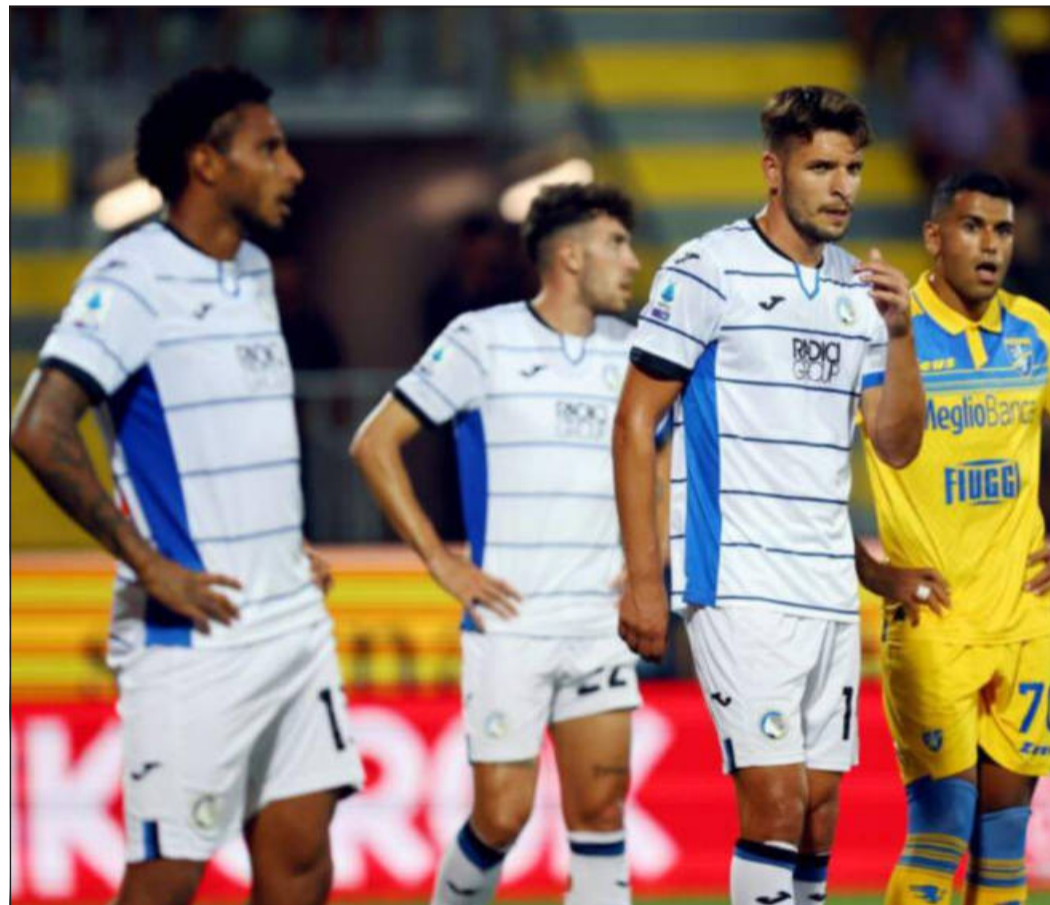
Nerazzurri spaesati allo "Stirpe" di Frosinone