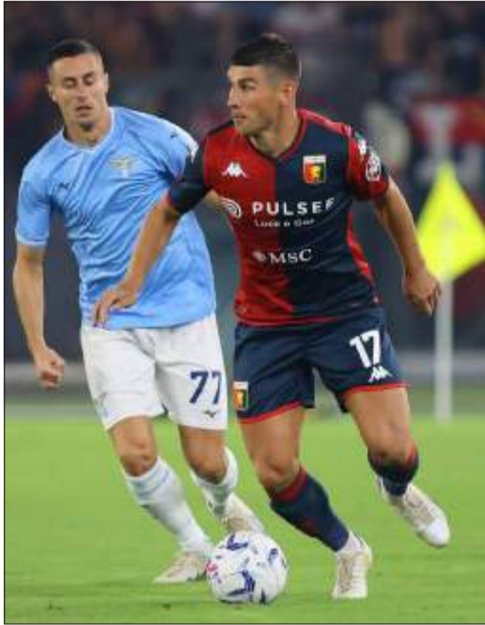
Ruslan Malinovskyi, grande ex atalantino

Il Genoa si presenta a Bergamo con 8 punti in cassaforte, bottino in perfetta linea con l'obiettivo stagionale che è quello di conquistare una salvezza senza troppi affanni. Mister Alberto Gilardino, sin dal suo insediamento in panchina nel precedente campionato di Serie B, ha riportato serenità alla piazza. Al Gewiss Stadium contro l'Atalanta servirà la prestazione perfetta. La sosta per le Nazionali ha contribuito in terra ligure a recuperare qualche pedina importante nello scacchiere tattico, ma fino all'ultimo rimarranno alcuni nodi da sciogliere. In porta l'unica certezza è la squalifica di Martinez dopo la gara interna contro il Milan che consegnerà i guantoni a Leali. Il pacchetto arretrato dovrebbe essere come sempre composto da quattro elementi e, soprattutto, da difensori puri. Al centro la coppia Dragusin-Bani, come terzini a destra De Winter e a sinistra Vasquez, che terzini non sono: la sensazione, quindi, è che il reparto sarà decisamente atipico come visto nelle precedenti uscite del Grifone. Al centro del campo si registrano i recuperi di due uomini di spessore come Badelj e Strootman, ma sul loro impiego rimane un grosso punto di domanda. Più probabile che il tecnico di Biella si affidi a Thorsby e Frentrup, non certamente rincalzi. Sulle corsie esterne i maggiori indiziati sono Sabelli a destra e Haps sulla mancina. In attacco, la notizia è che Retegui è out. L'ex Malinovskyi è così destinato a disimpegnarsi alle spalle dell'unica punta che risponde al