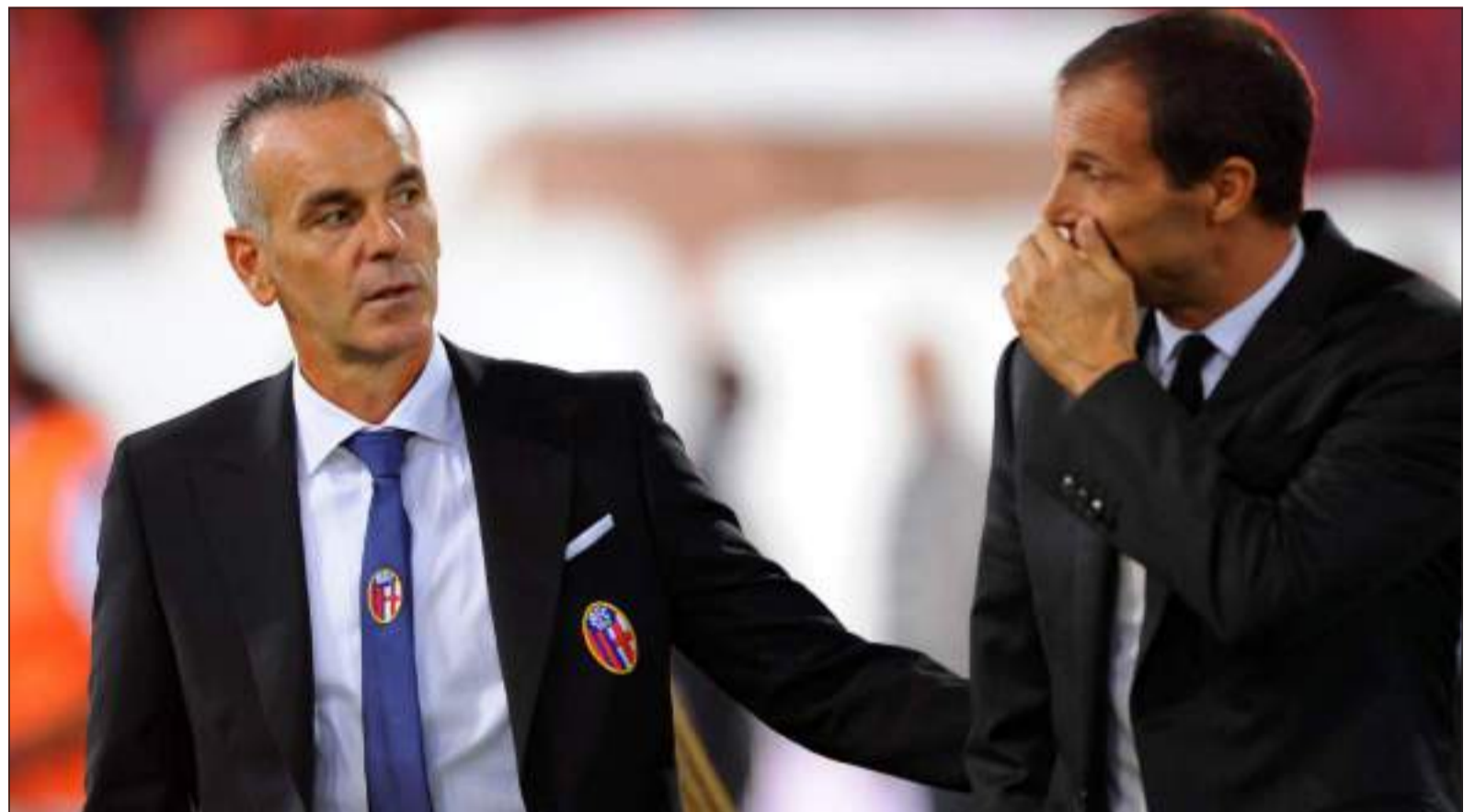
Stefano Pioli e Massimiliano Allegri durante un Bologna-Milan del 2013. Stasera saranno avversari per l'ennesima volta

JUVENTUS: Szczesny, Bremer, Rugani, Gatti, McKennie, Miretti, Locatelli, Rabiot, Kostic, Vlahovic, Chiesa. All. Allegri.