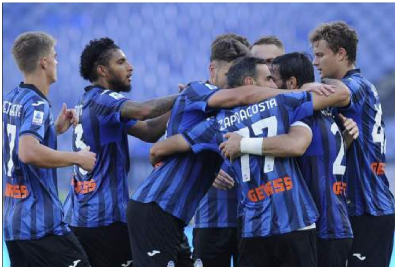
Atalanta chiamata al successo nel match interno con il Genoa. Fischio d'inizio alle 18, arbitra Marinelli di Tivoli. I nerazzurri, ancora senza Koopmeiners, si troveranno di fronte un avversario che ha ben figurato in questo primo scorcio di stagione. Tra i liguri spauracchio Gudmunsson, mentre sarà assente bomber Retegui

SERIE A Dopo il ko con la Lazio e la sosta, al Gewiss arriva il Genoa di Alberto Gilardino