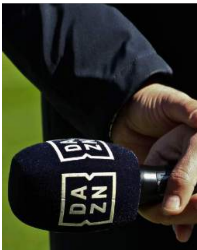
Domani potrebbe essere un giorno decisivo per la questione diritti televisivi