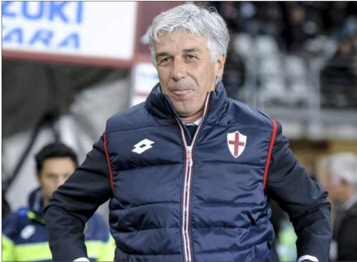
Gian Piero Gasperini ai tempi del Genoa