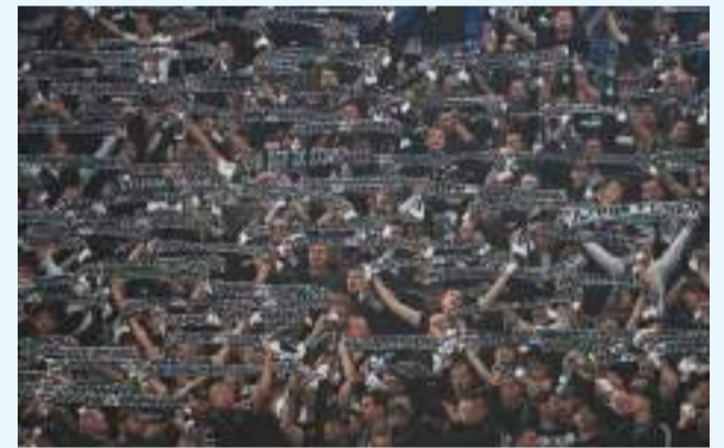
I tifosi dello Sturm Graz