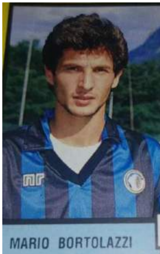
Con la maglia dell'Atalanta