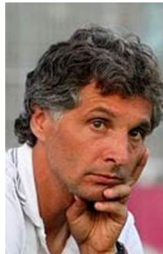
E in tempi più recenti

cordo ancora come una delle più passionali e vicine alla squadra incontrate nel corso della mia carriera". Bortolazzi associa il calore della curva bergamasca a quella genoana, la squadra in cui militò dal 1990 al 1997, otto stagioni che per il Grifone furono caratterizzate da grandissime gioie (storica la semifinale in Coppa Uefa e la vittoria ad Anfield ai danni del Liverpool firmata da Pato Aguilera, grandissimo bomber uruguayano), ma anche dalla dolorosa retrocessione in Serie B nello spareggio giocato contro il Padova in cui militava l'americano Alexi Lalas. "Quel Genoa era una squadra spettacolare - ricorda Bortolazzi -: ci giocavano campioni come Aguilera, Skhuravy e soprattutto Branco, terzino brasiliano dotato di un tiro e di un calcio piazzato ai limiti del sovraumano e una città intera era ai piedi di quel Genoa, che però subì una drammatica retrocessione nel '95 e ci mise ben 10 anni per riemergere dal purgatorio della Serie B". Un Genoa rinnovato, invece, è quello attuale appena risalito in A dalla cadetteria e guidato da un super campione del mondo come Alberto Gilardino con giocatori di qualità ed