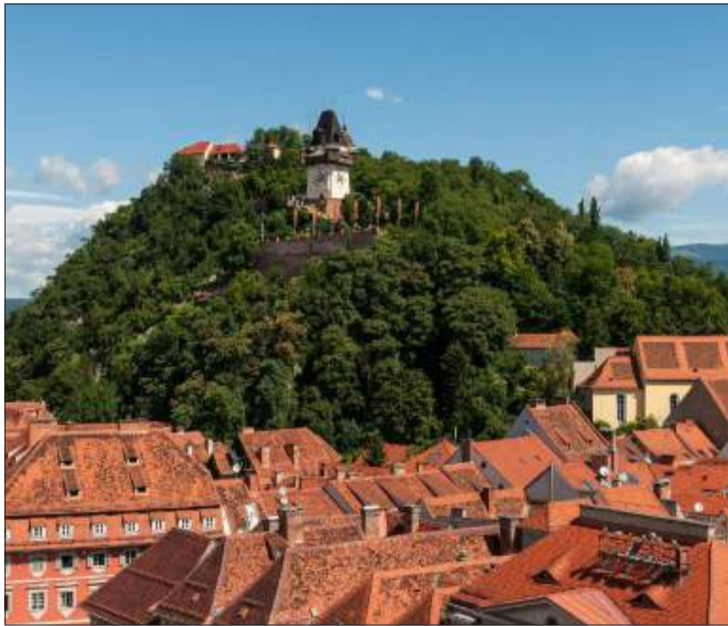
Alcune immagini di Graz. A destra il kren stiriano

Graz è un incrocio tra storia e innovazione; infatti, negli ultimi anni, sono stati eretti nuovi edifici come il museo d'arte moderna (Kunsthaus) di Peter Cook e Colin Fournier, un museo costruito sulla riva del Mur e la Murinsel, cioè l'isola sul Mur, un'isola fatta d'acciaio costruita in mezzo al fiume. Lo Schlossberg è una collina che si trova nel centro storico, attorno alla quale si sviluppa la città vecchia e dalla quale potrete ammirare Graz dall'alto. In tedesco Schloss significa castello, mentre Berg significa montagna. La torre dell'orologio, simbolo della città, è quanto rimane dell'antica for-