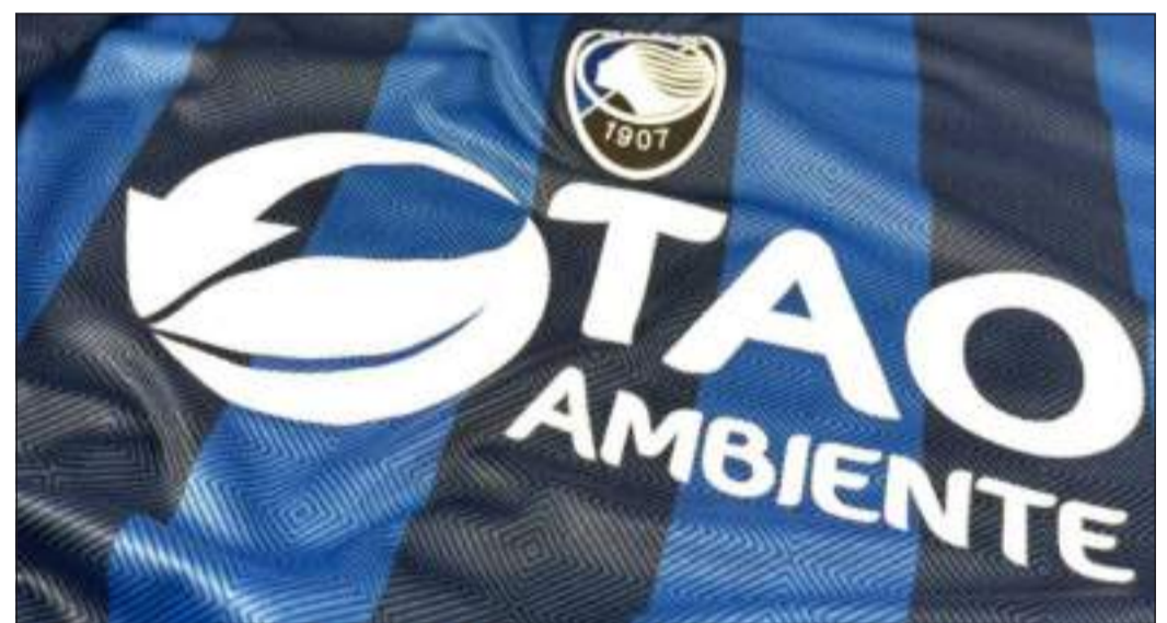
Tao Ambiente è il nuovo sponsor di maglia dell'Atalanta Under 23