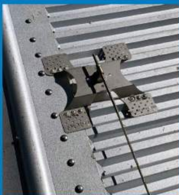
Coperture & Lattoneria