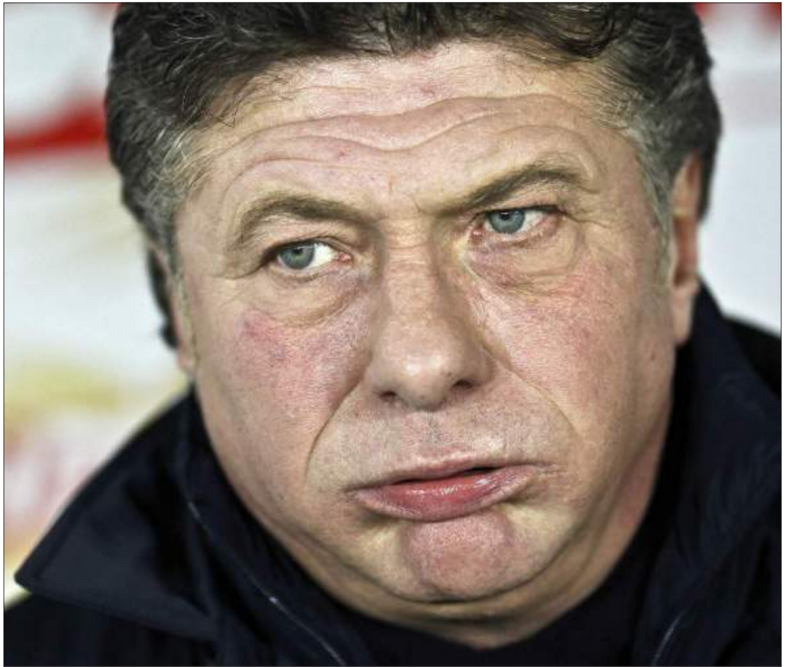
Walter Mazzarri torna sulla panchina del Napoli