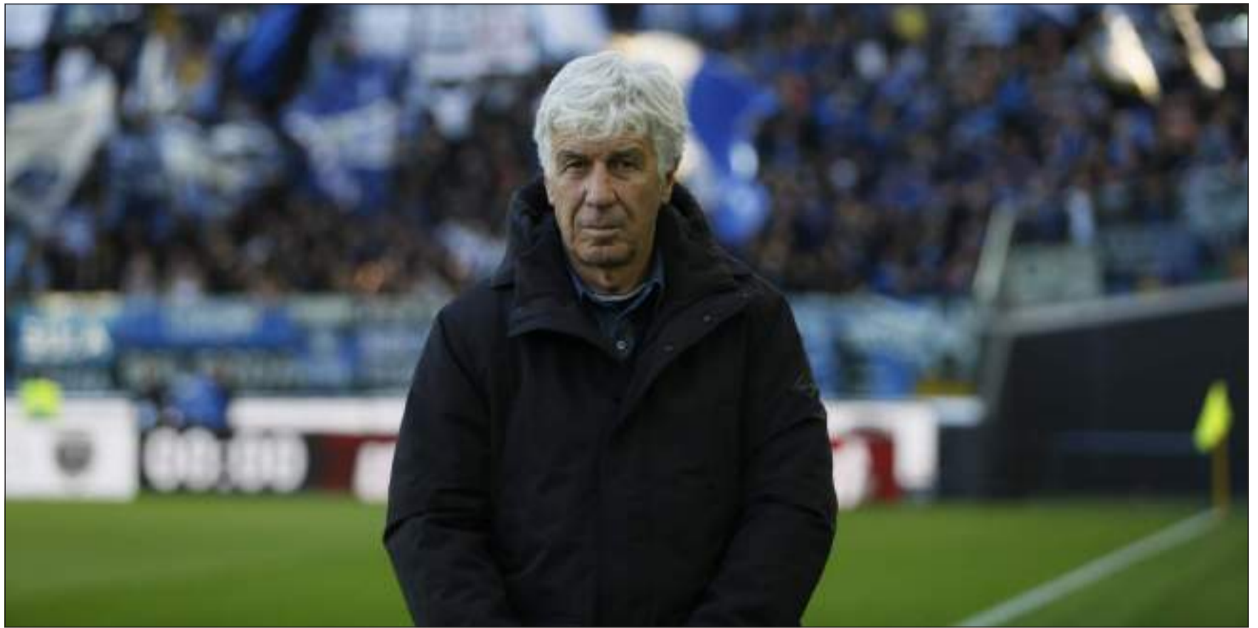
Gian Piero Gasperini durante la sfida di Udine

Comincia la conta di chi non ce la fa e chi sì: “Palomino e Tolo rimangono fuori, Scalvini e Kolasinac hanno recupe-