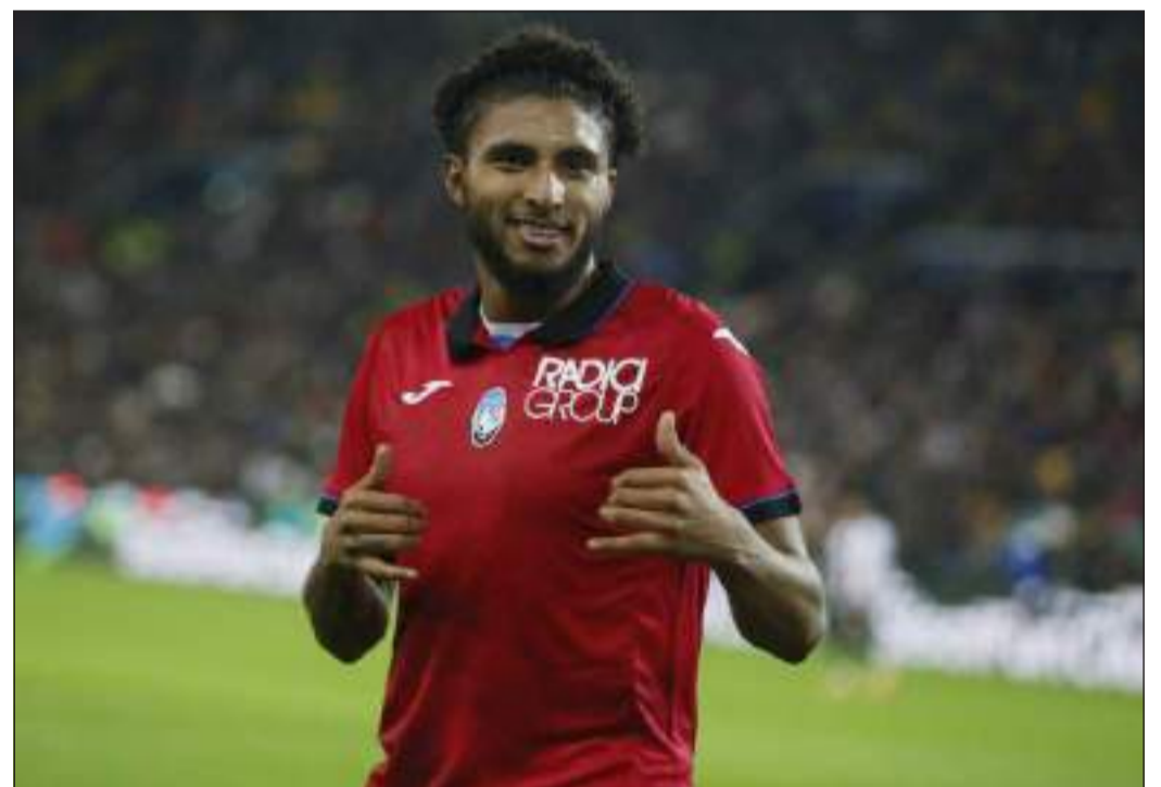
Ederson, autore del gol nerazzurro a Udine