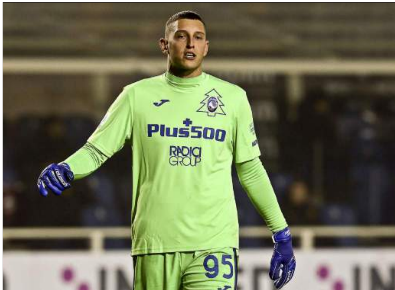
Giornata da ex per Pierluigi Gollini

A volte dopo lunghissimi viaggi le vite delle persone si ritrovano ed è proprio il caso del match di stasera, Atalanta-Napoli, dove Pierluigi Gollini incontrerà di nuovo i suoi ex-tifosi sotto le vesti di avversario e con una squadra diversa. Il portierone attualmente in forza al Napoli ha saputo regalare momenti di gioia e felicità qui a Bergamo negli anni della sua permanenza ottenendo così rispetto da parte di tutto il popolo atalantino. Resterà iconico per tutti il rigore parato al numero 7 più forte al mondo, il Gollo durante quel famoso Juventus-Atalanta è stato capace di neutralizzare il penalty di Cristiano Ronaldo con una freddezza da capogiro. Piergollo arrivò a Bergamo in prestito con diritto di riscatto per 18 mesi nel lontano gennaio del 2017, dovendo ricoprire il ruolo di secondo portiere dietro a Etrit Berisha e il suo esordio da titolare avvenne il 19 marzo nella partita Atalanta-Pescara vinta da noi per 3-0; durante quella stagione non spiccò più di tanto dato che ottenne uno spazio pressappoco nullo e collezionò solo 4 presenze. Durante il campionato 2017-2018 ebbe leggermente più libertà di dimostrare il suo valore e le maglie da titolare furono 7. La stagione della consacrazione per "Gollorius" (che è il suo nome da rapper visto che ha intrapreso una carriera secondaria nel mondo della musica oltre che al calcio) è proprio quel-