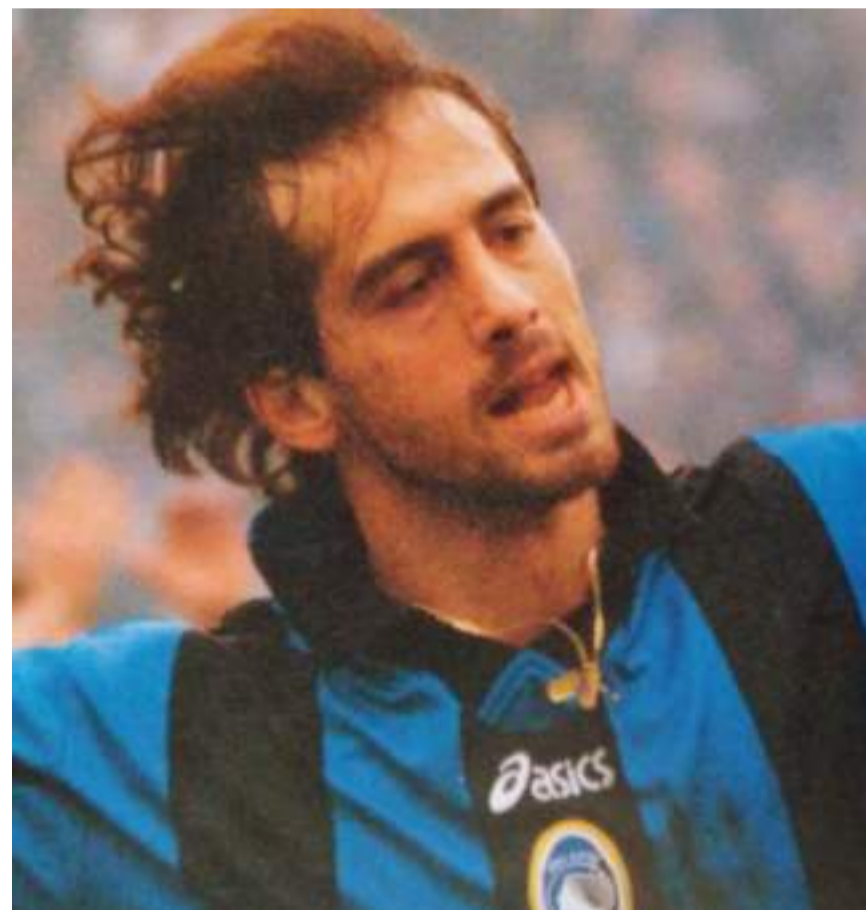
... e con quella dell'Atalanta