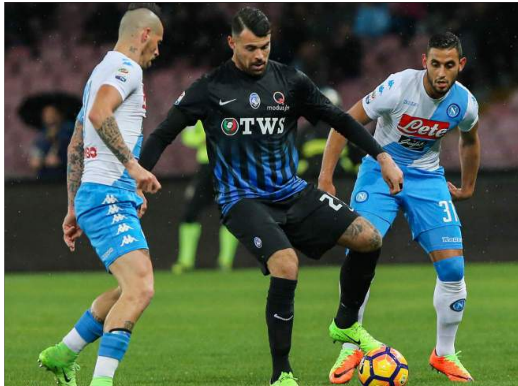
Andrea Petagna in maglia nerazzurra durante una sfida col Napoli