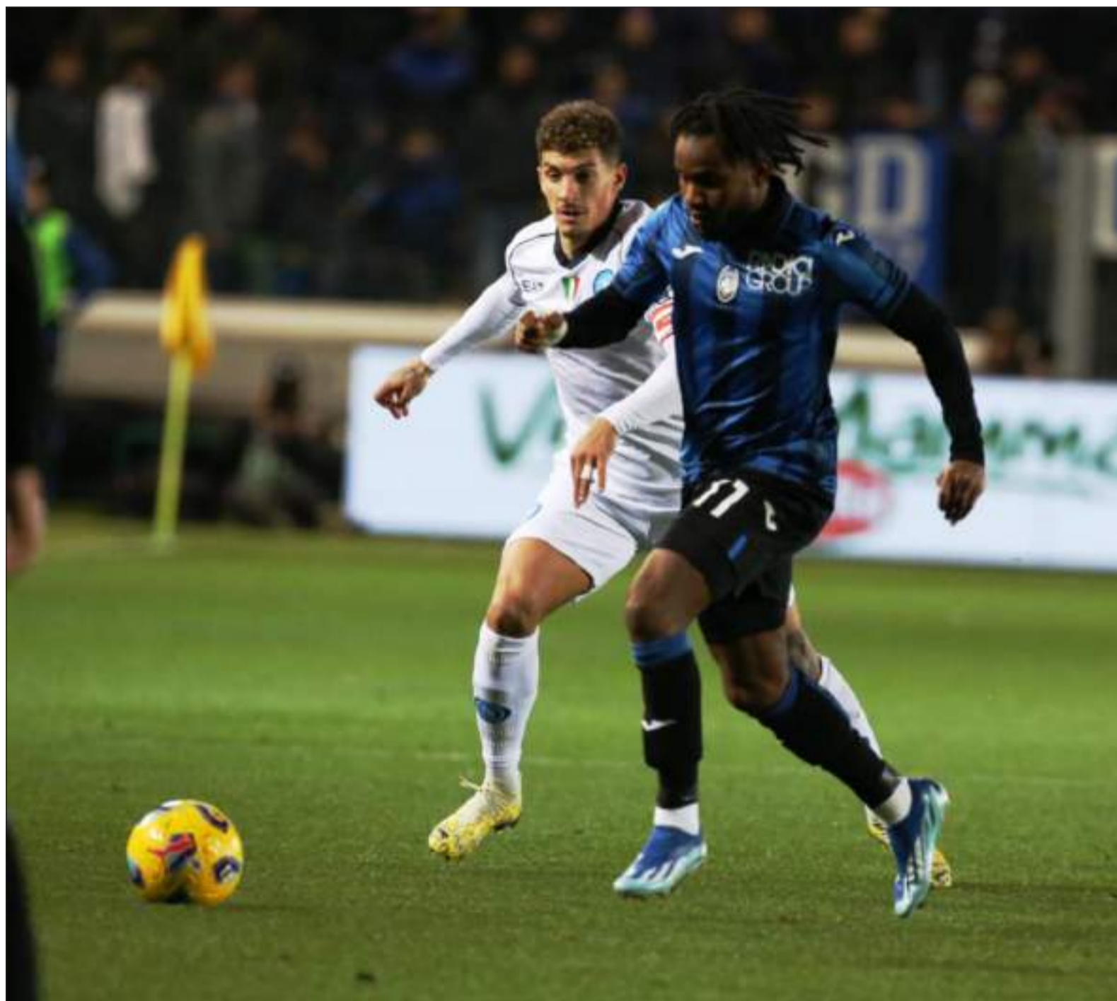
Leonardo Bosco Ademola Lookman inseguito da Di Lorenzo durante Atalanta-Napoli di sabato scorso