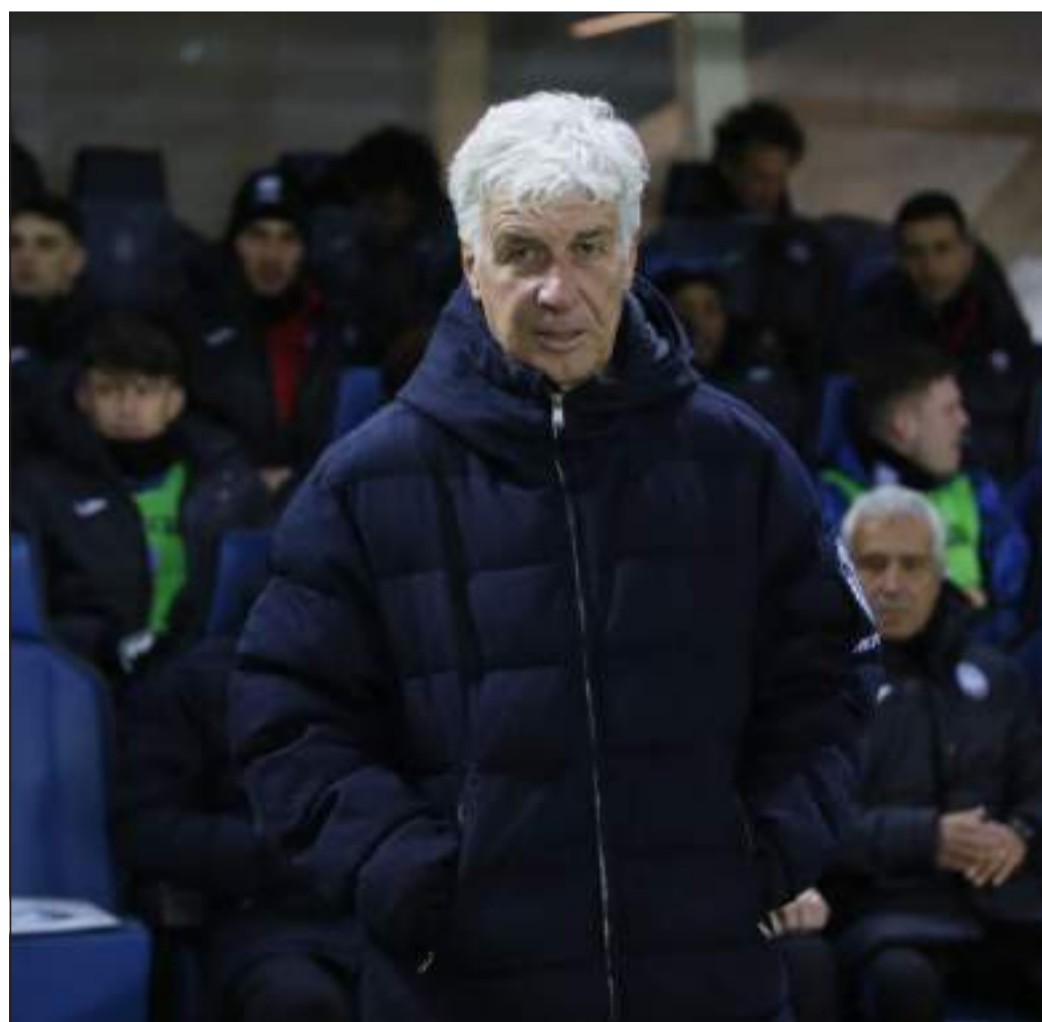
CONDOTTIERO - Gian Piero Gasperini