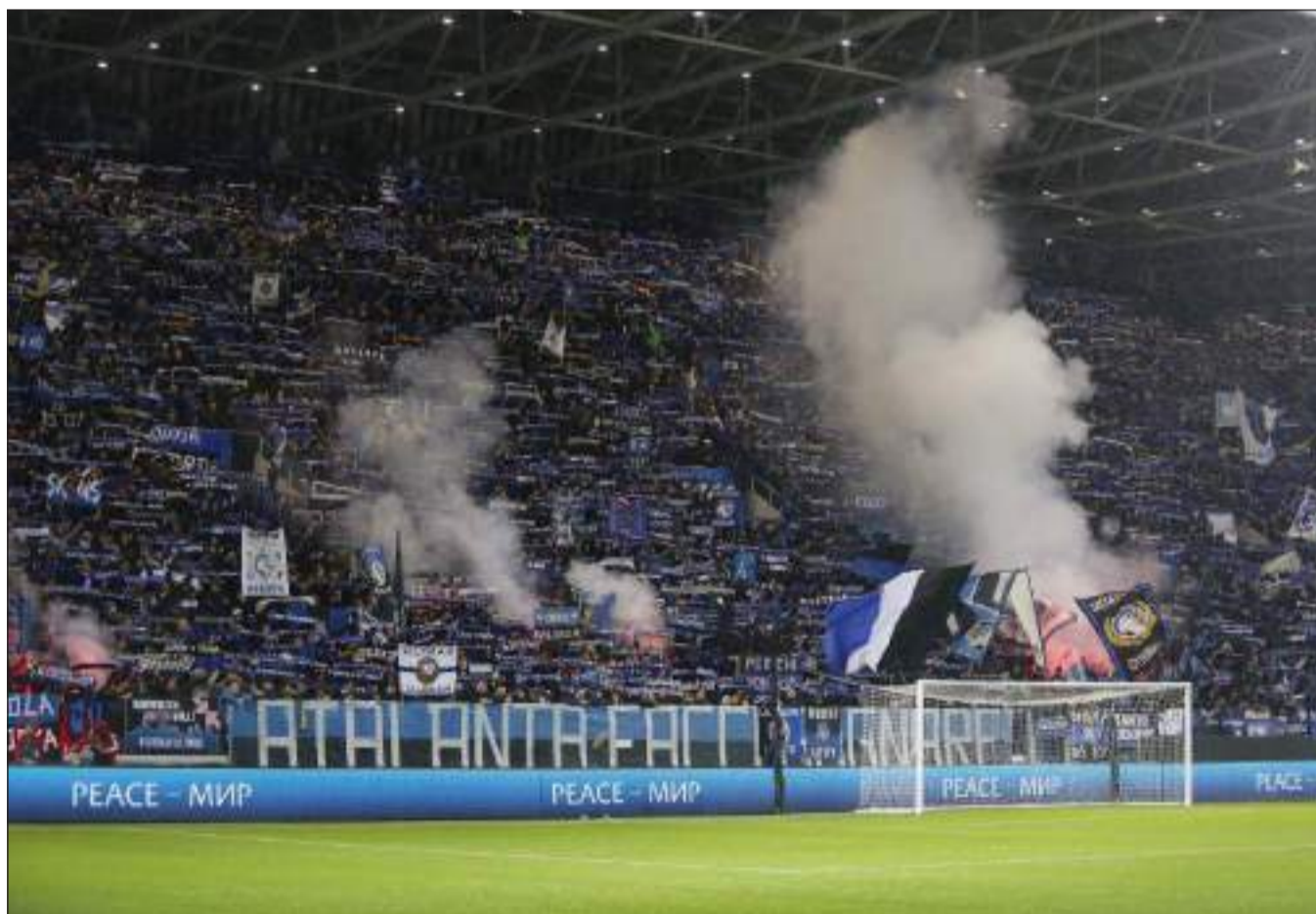
La curva nerazzurra in occasione dell'ultima sfida interna di Europa League, vinta contro lo Sturm Graz. Questa sera l'Atalanta ha a disposizione due risultati su tre per garantirsi il primato nel girone. Recuperato Kolassinac, Gasperini perde De Ketelaere e Zappacosta. Scamacca guiderà l'attacco nerazzurro

EUROPA LEAGUE Basta un pareggio con lo Sporting per assicurarsi gli ottavi di finale