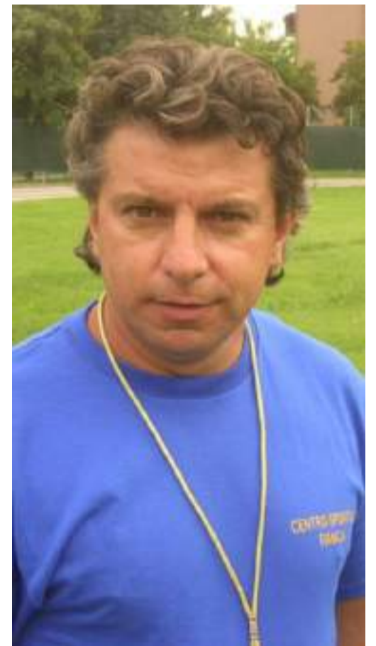
... e in uno scatto più recente