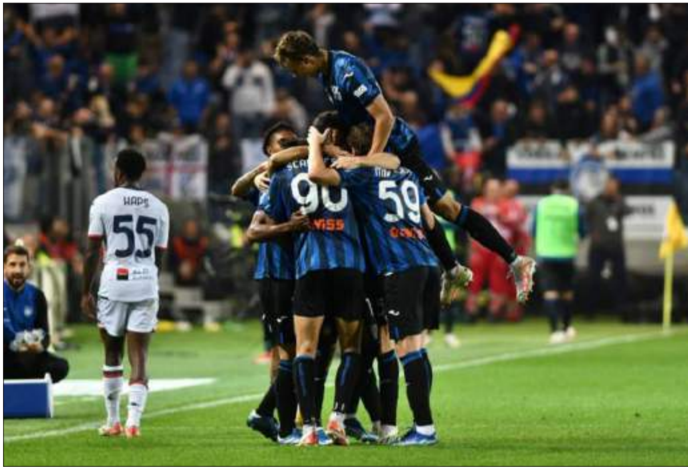
GIOIA ATALANTINA - I tifosi nerazzurri sperano di rivedere scene di festa al termine del match di questa sera