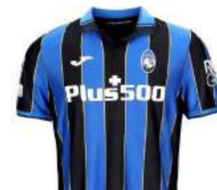
La prima maglia 2021/2022