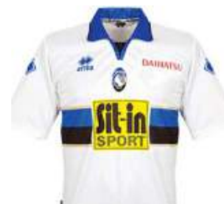
La maglia da trasferta 2007-2008