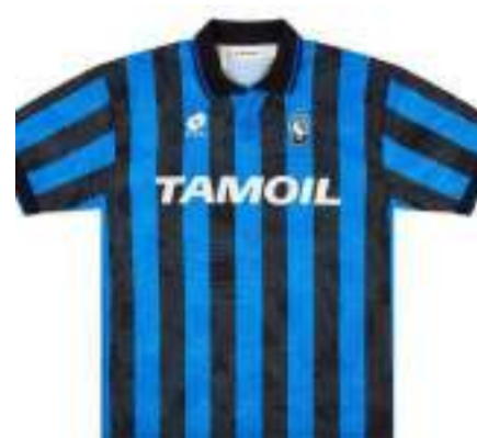
La maglia home '93/'94