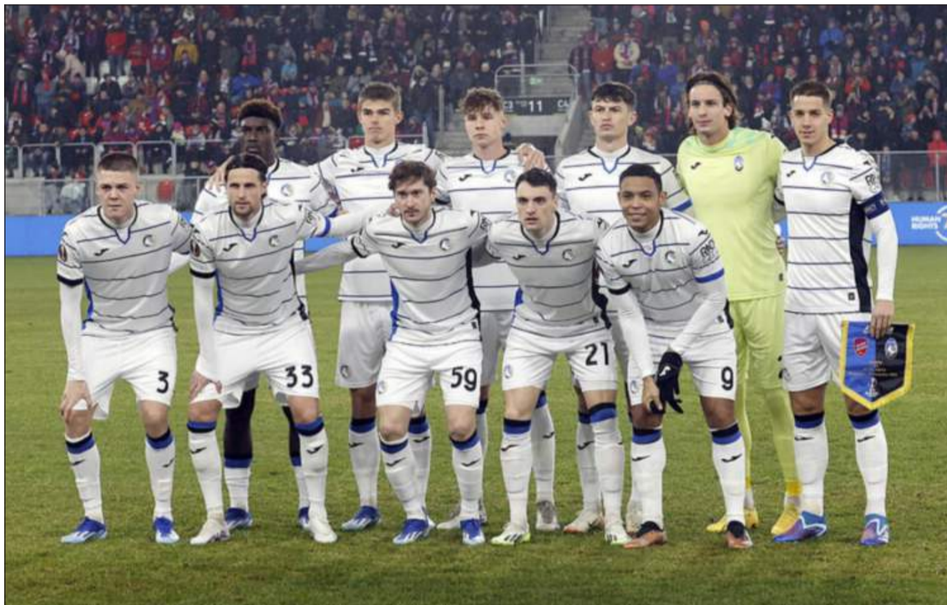
BABY BOOM - La formazione messa in campo da Gasperini nell'ultimo turno della fase a gironi in Europa League