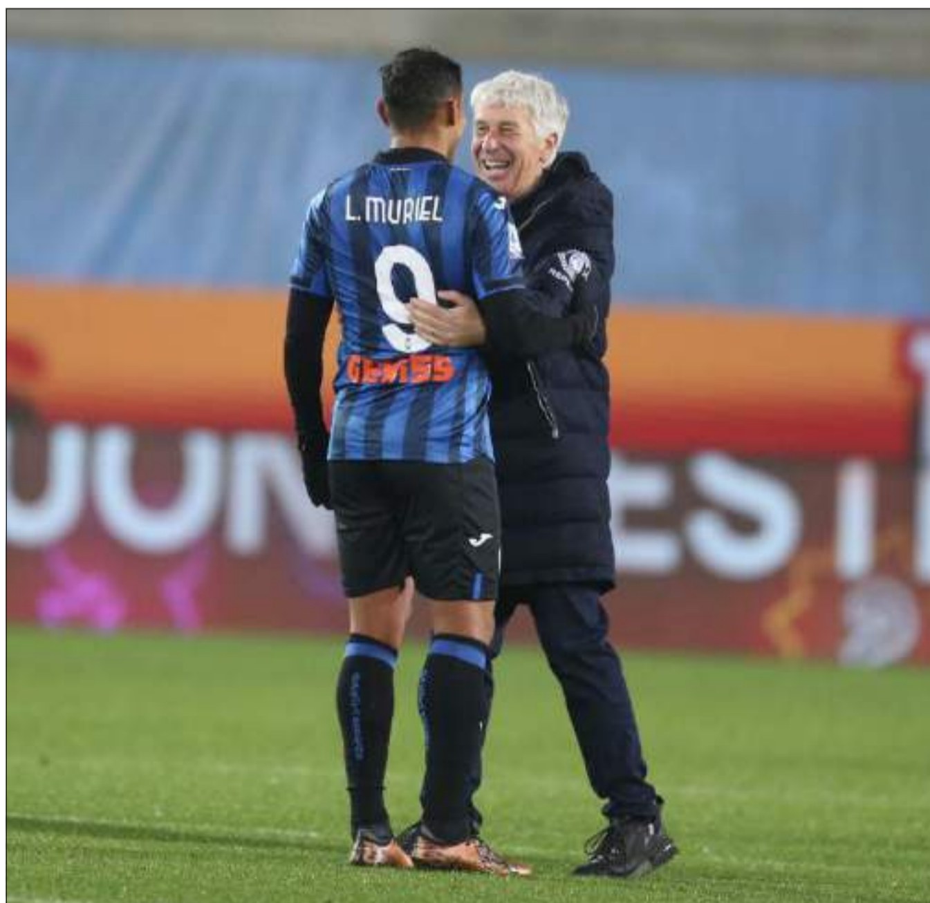
MDC L'ABBRACCIO TRA IL MISTER E IL SUO TALENTO - Gasperini e Muriel al fischio finale di Atalanta-Milan