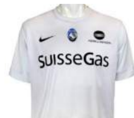
La maglia away 2014-2015