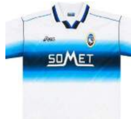
La maglia da trasferta 97/98