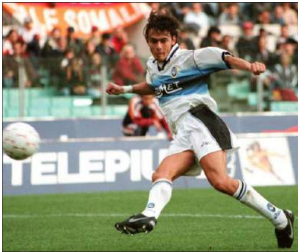
SUPER PIPPO - Due immagini di Inzaghi con la maglia della Dea nella stagione 1996-1997