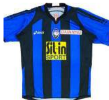
La maglia di casa 2006/2007