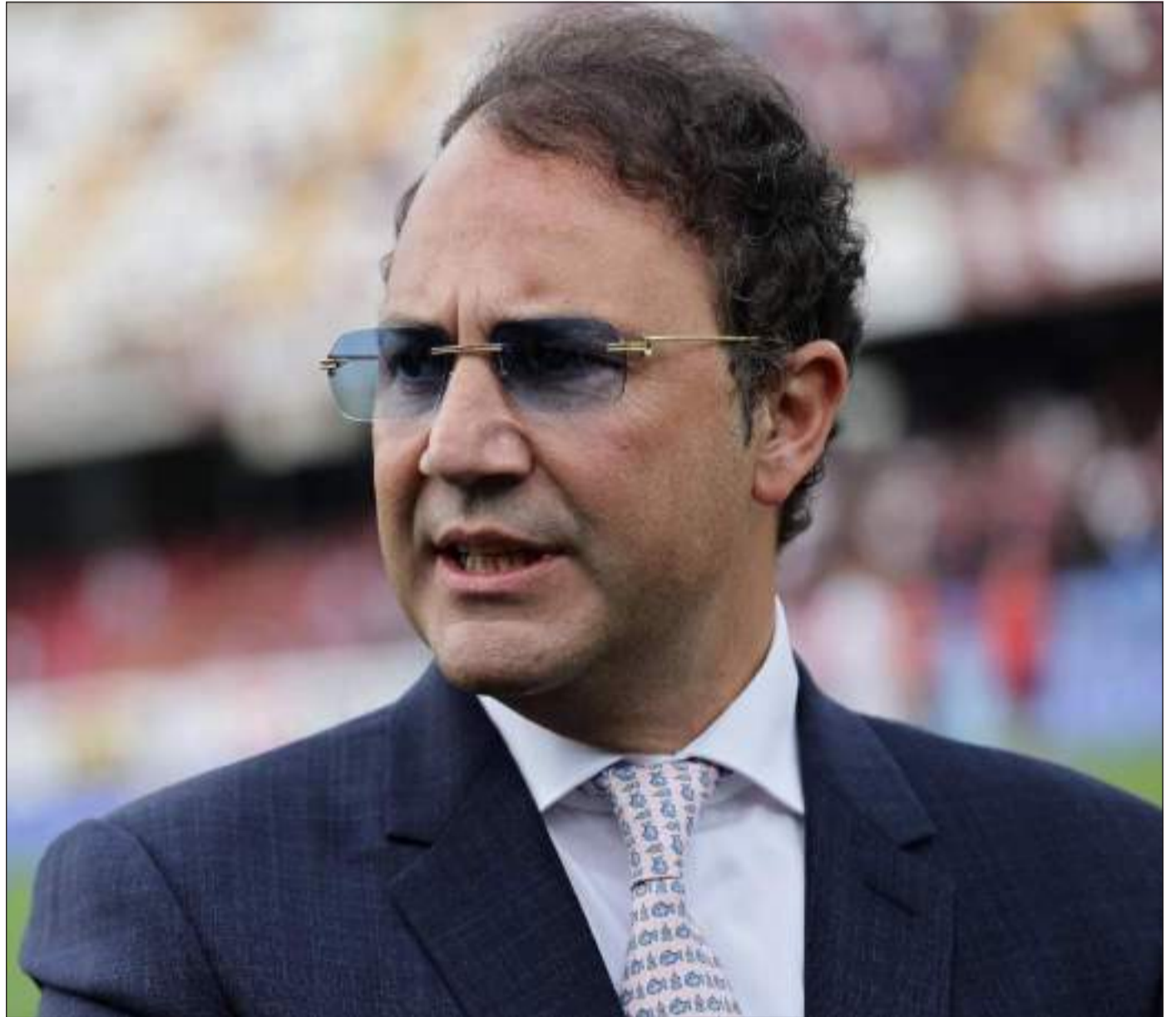
PROPRIETARIO DELLA SALERNITANA - Un'immagine di Danilo Iervolino