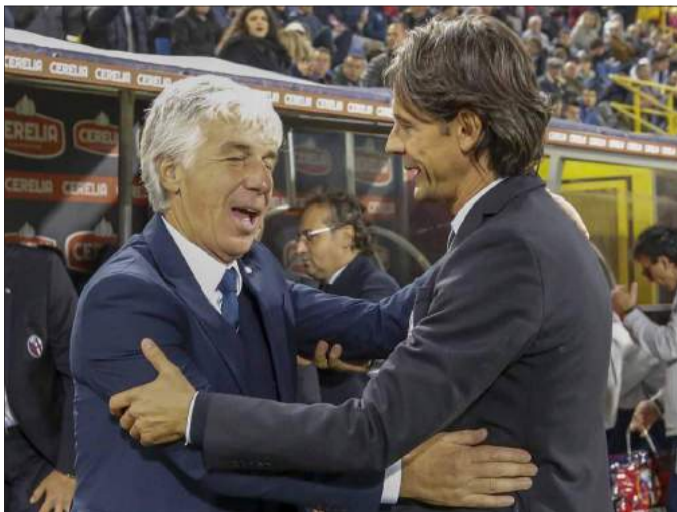
OBIETTIVI DIVERSI - Gasperini sogna la qualificazione in Champions, Inzaghi la salvezza

SERIE A Nerazzurri in posticipo al Gewiss contro la Salernitana di mister Pippo Inzaghi