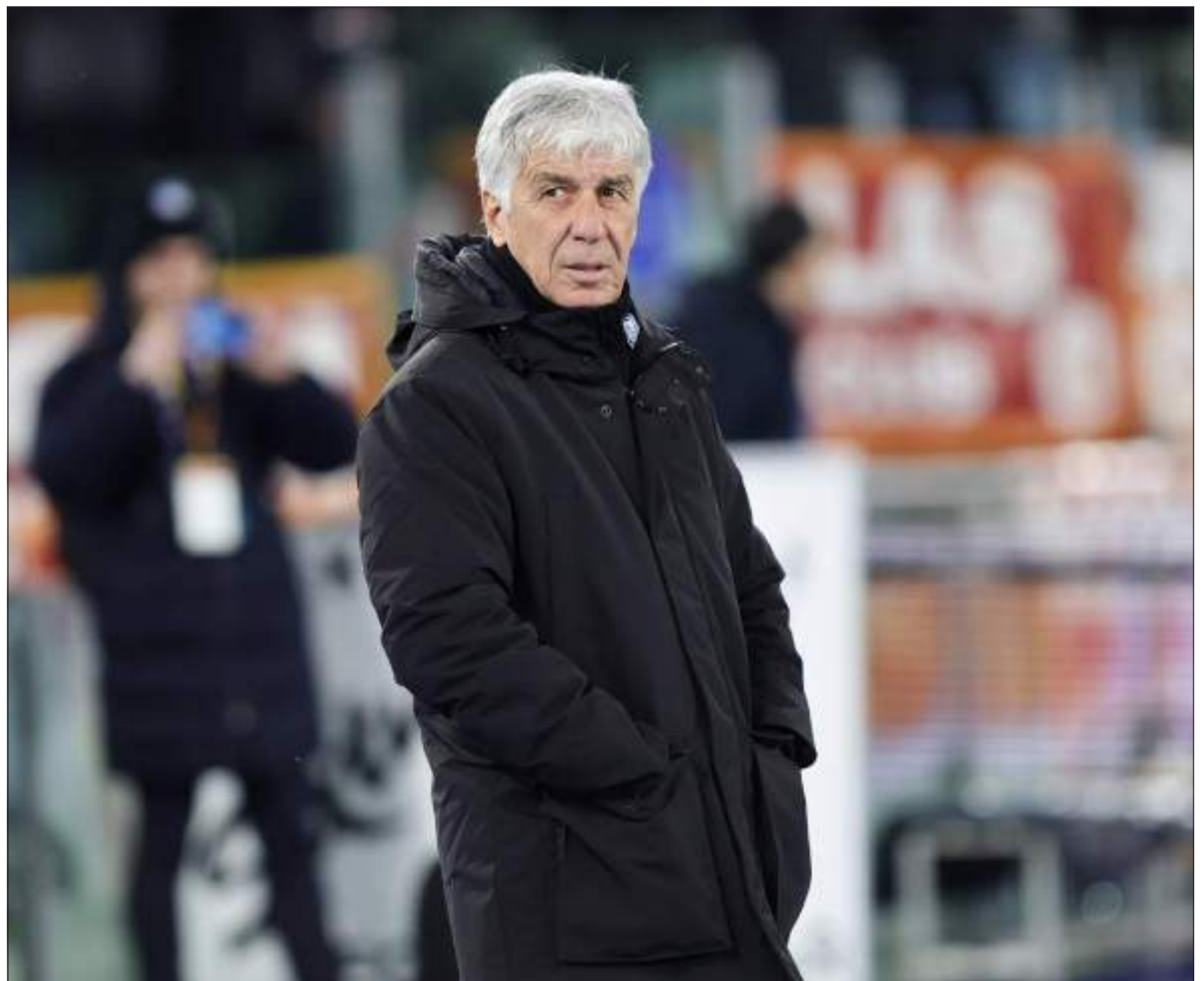
Gian Piero Gasperini siede sulla panchina dell'Atalanta dall'estate del 2016

4 febbraio: Atalanta-Lazio 11 febbraio: Genoa-Atalanta 17 febbraio: Atalanta-Sassuolo 25 febbraio: Milan-Atalanta 28 febbraio: Inter-Atalanta 3 marzo: Atalanta-Bologna 7 marzo: andata ottavi di finale di Europa League 10/11 marzo: Juventus-Atalanta 14 marzo: ritorno ottavi di finale di Europa League 17/18 marzo: Atalanta-Fiorentina 23/24 marzo: Napoli-Atalanta