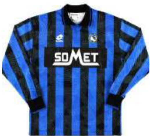
La prima maglia del 1994/1995

LA RUBRICA Termina il nostro viaggio alla scoperta delle maglie più iconiche dell'Atalanta