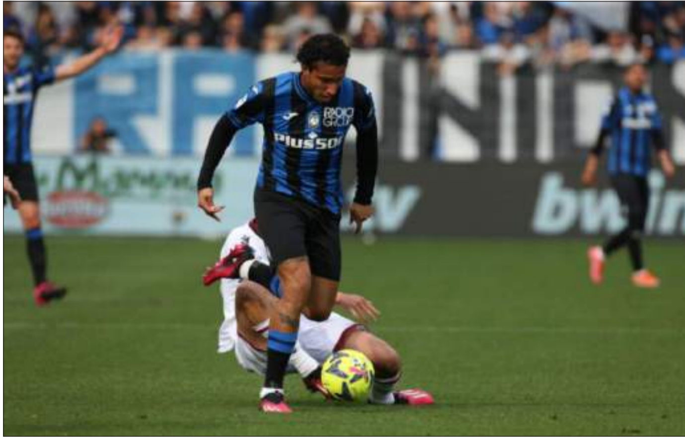
IL RAGAZZO DEL 99 - Ederson è uno degli atalantini dal rendimento migliore

Uno scontro diretto, una sfida, un duello. Chiamatela come volete ma la partita tra Atalanta e Lazio, valida per il turno numero ventitre del campionato, ha un significato profondo e, forse, decisivo per la posizione di classifica. La Dea è al quarto posto a quota 36, la Lazio indietro di due punti, quindi un successo dei nostri beniamini in maglia nerazzurra allontanerebbe in modo vistoso i rivali laziali. E, ovviamente, per i ragazzi di Sarri vale il contrario. Ecco perché, nel nostro panorama calcistico, è una partita di grande importanza strategica che ha come fine un posto in Europa, quello decisamente più appetito. Certo, c'è ancora molto tempo, dopo, ci sono ancora sedici partite da giocare ma intanto i tre punti sarebbe un robusto segnale. In questa stagione l'Atalanta sta costruendo le sue fortune vincendo le partite in casa, rovesciando la tendenza degli scorsi campionati e ha cambiato registro anche sugli scontri diretti casalinghi con il pareggio con la Juve e la vittoria sul Milan. Durante le undici vittorie i nerazzurri hanno segnato ventidue gol e ne hanno subiti tre, due gol del Milan e uno con la Salernitana. Dunque, casa, dolce casa. L'Atalanta, quindi, si presenta nel suo momento migliore ed ha ripreso la corsa, in maniera piuttosto spedita: non asfissa più gli avversari, li avvolge, li abbindola e, alla fine, con i suoi