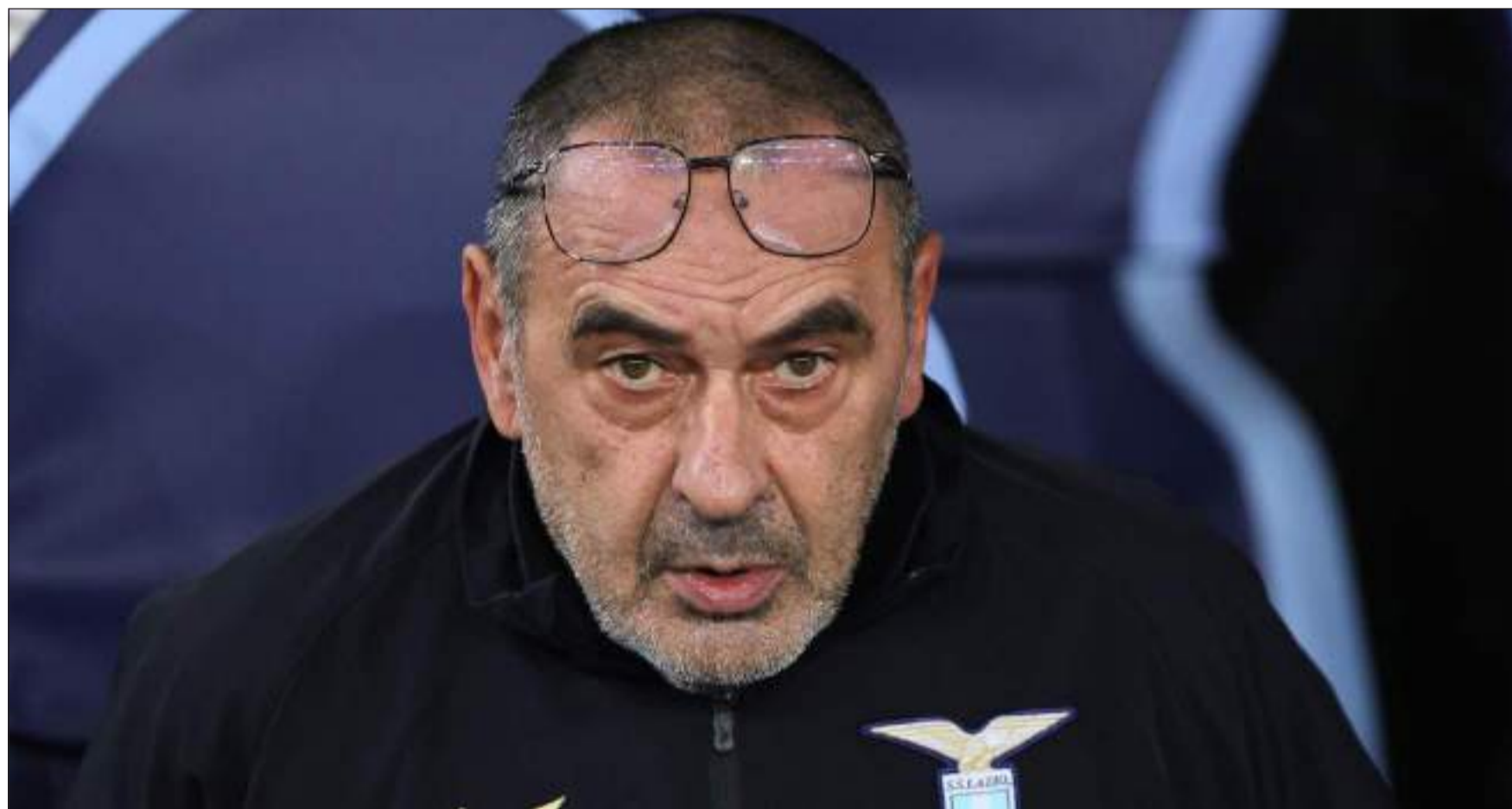
Terzo anno sulla panchina della Lazio per Maurizio Sarri