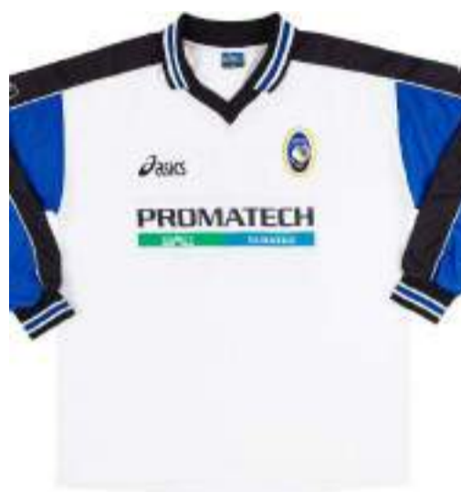
La seconda maglia 2003/2004

Rimaniamo sempre in ambito seconda maglia con la divisa della stagione 2003-2004 firmata Asics, dal design decisamente molto sportivo. Il kit è strutturato nella zona centrale del busto in tinta unita bianco e incontra il nero e azzurro lungo le maniche con la parte superiore che parte dalle spalle fino ai polsini una striscia nera, il resto in della manica è in blu. I polsini e il colletto hanno la stessa trama a righe nere, bianche e azzurre. Al centro del petto troviamo lo sponsor Promatech, sulla sinistra lo stemma dell'Atalanta contornato di oro e sulla destra Asics. I campioni nerazzurri riuscirono a fine campionato a risalire in alto e tornare tra le grandi italiane grazie soprattutto alle prodezze di Budan che vinse il premio capocannoniere al termine della stagione.