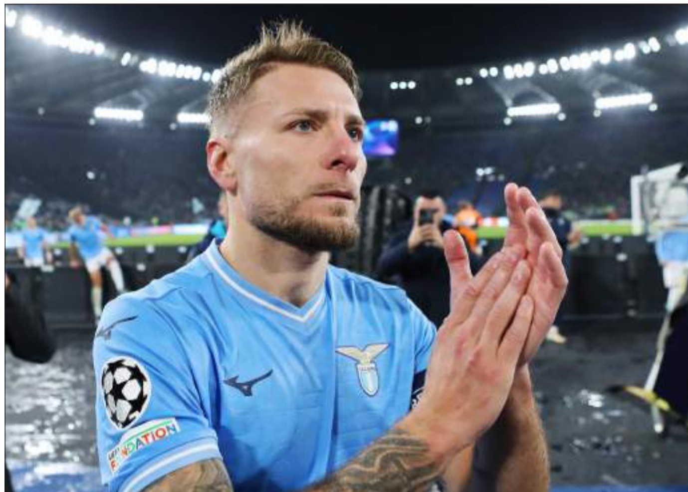
CAPITANO - Ciro Immobile è nato il 20 febbraio del 1990 a Torre Annunziata

All'avvicinamento della sfida contro l'Atalanta, il rendimento stagionale della Lazio è inconfutabilmente al di sotto delle aspettative delle griglie di partenza estive. Certamente, il secondo posto ottenuto nella scorsa stagione è stata una variabile di non poco conto per gli addetti ai lavori nel considerare la squadra biancoceleste una delle candidate più accreditate ad ambire a un posto nell'europa che conta. Considerando il fatto che i capitolini si trovano solamente a due punti dal quarto posto - in questo caso la sfida di Bergamo diventa un vero e proprio snodo stagionale - il rendimento della squadra di Maurizio Sarri ha mostrato un'inusuale alternanza di risultati. Se è vero che i numeri non mentono mai, il dato che preoccupa maggiormente gli uffici di Formello è sicuramente quello dei gol realizzati: infatti sono solamente 24 le reti messe in fila dai biancocelesti in questo campionato; la seconda rosa peggiore fra le prime dieci sorelle in Serie A, davanti solo al Torino con 20. Un anno fa, a questo punto della competizione, la Lazio aveva portato in dote 36 centri. Numeri decisamente differenti, che spiegano le glorie del passato e le difficoltà del presente del Club. Le motivazioni di questa carenza realizzativa sono molteplici, a cominciare dalla partenza e il mancato ingaggio di un sostituto all'altezza di Milinkovic Savic . Le iniziative e gli assist a profusione sono stati grasso che cola per tutti gli otto anni di permanen-