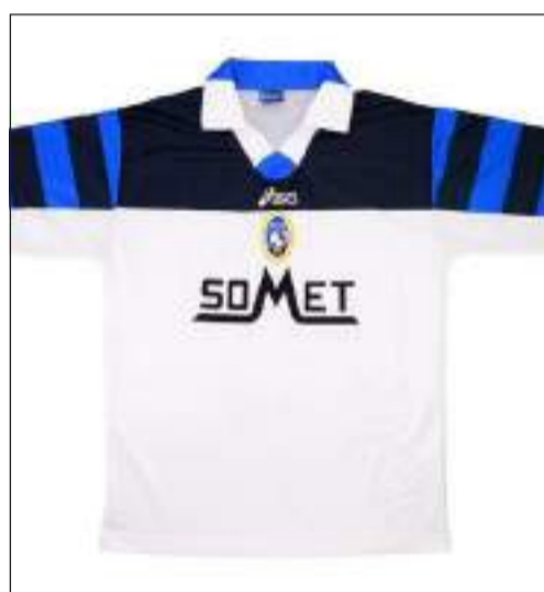
La maglia da trasferta del '98/'99

Ora saltiamo avanti di qualche anno fino al campionato 98-99 di Serie B. Sono gli anni di