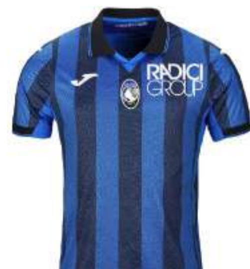
La prima maglia di quest'anno