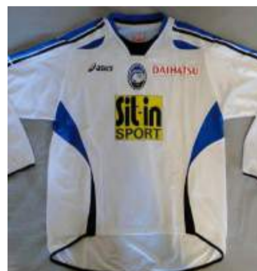
E quella del 2006/2007

Terminiamo la nostra corsa tra le maglie della Dea arrivando ai tempi d'oggi con la prima divisa confezionata da Joma; il dettaglio tipico del kit in casa è la presenza delle strisce verticali abbastanza spesse nere e azzurre. A donare un tocco di particolarità proprio sulle bande troviamo questo tema geometrico romboidale che si può notare solamente guardando la divisa da vicino. Il colletto della maglia è a "V", nero bordato di azzurro. Lo stemma, posto centralmente, va ad acquisire importanza. Stilisticamente e graficamente è disegnata benissimo, inoltre ri-