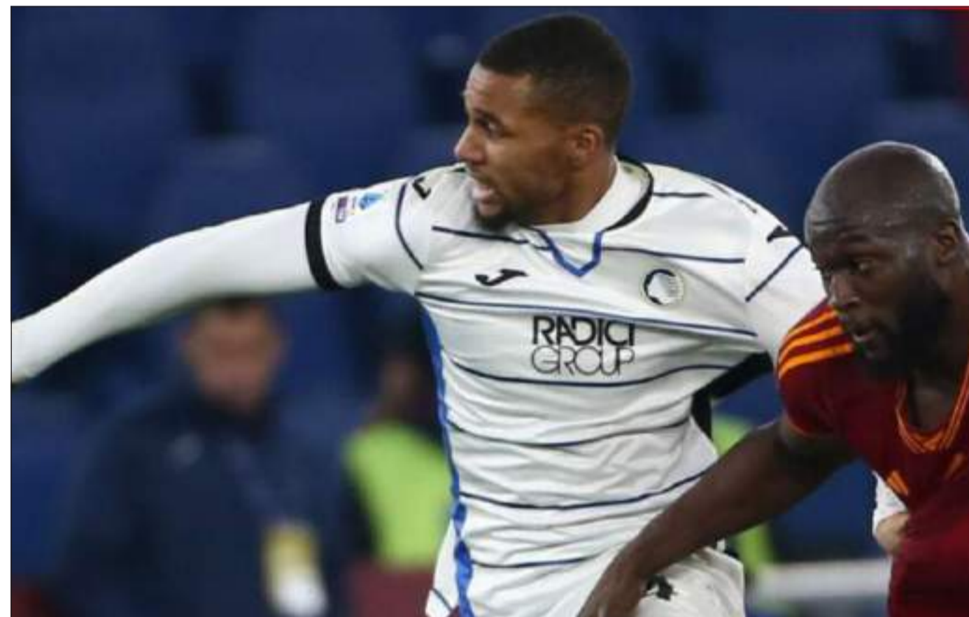
CENTRALE - Hien, svedese, 25 anni, qui in azione contro Lukaku