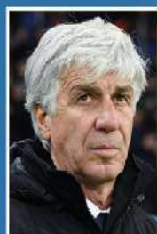
All. Gian Piero Gasperini

31 FRANCESCO ROSSI 1 JUAN MUSSO 29 MARCO CARNESECCHI 2 RAFAEL TOLOI 6 JOSÈ LUIS PALOMINO 19 BERAT DJIMSITI 77 DAVIDE ZAPPACOSTA 23 SEAD KOLASINAC 33 HANS HATEBOER 20 MITCHEL BAKKER 3 EMIL HOLM 22 MATTEO RUGGERI 42 GIORGIO SCALVINI 4 ISAK HIEN 43 GIOVANNI BONFANTI 15 MARTEN DE ROON 59 ALEKSEY MIRANCHUK 8 MARIO PASALIC 7 TEUN KOOPMEINERS 25 MICHEL NDARY ADOPO 13 ÈDERSON 17 CHARLES DE KETELAERE 90 GIANLUCA SCAMACCA 11 ADEMOLA LOOKMAN 10 EL BILAL TOURÈ 54 SIREN DIAO