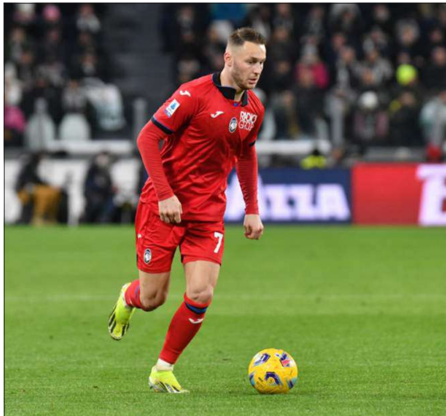
GRANDE TALENTO - Teun Koopmeiners, classe 1998