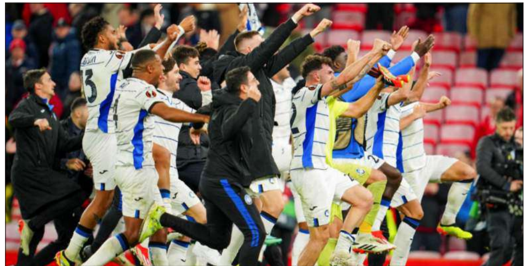
La festa dei nerazzurri dopo il 3-0 rifilato al Liverpool