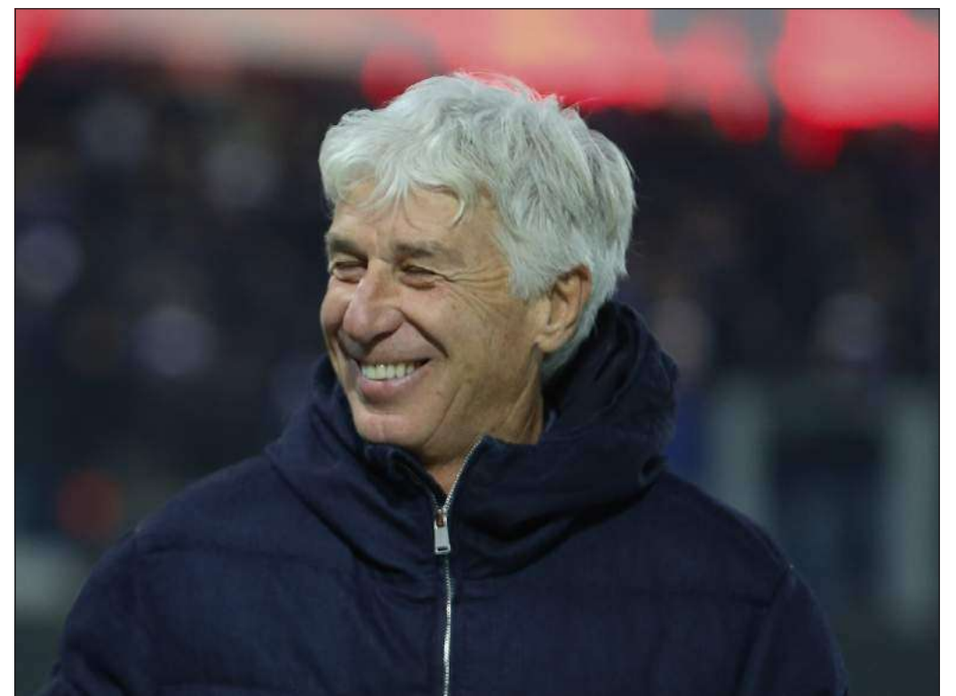
FELICE - Mister Gasperini, la sua Atalanta è in corsa su tre fronti