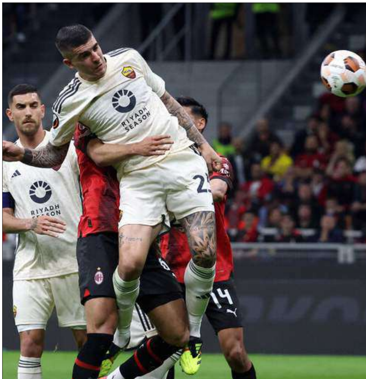
MDC La rete di Mancini che ha deciso l'andata dei quarti di Europa League tra Milan e Roma