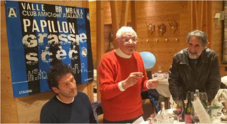
Alcune immagini della bellissima serata nerazzurra andata in scena martedì a Branzi