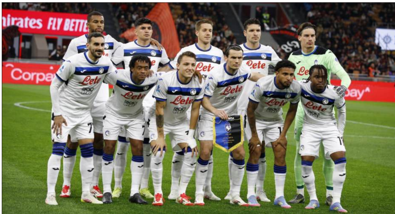
LUCI A SAN SIRO - L'Atalanta che ha battuto il Milan al Meazza

L'importante è non sbandare rispettando i segnali di stop e i semafori, anche perché il Lecce oggi si gioca una fettina neppure troppo minimale di una salvezza difficoltosa e, seppur il Monza sia ormai in serie B da tempo essendosi arreso precocemente a una stagione stortissima, il Parma a Bergamo all'ultima giornata potrebbe dover avere ancora qualcosa da dire pur col vantaggio morale di aver battuto l'armata Brancaleone giuntoliana