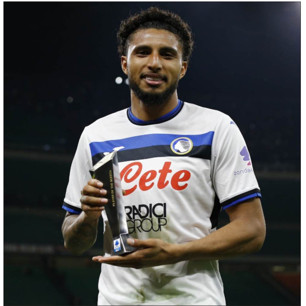
MVP - Ederson, 25 anni, premiato a San Siro