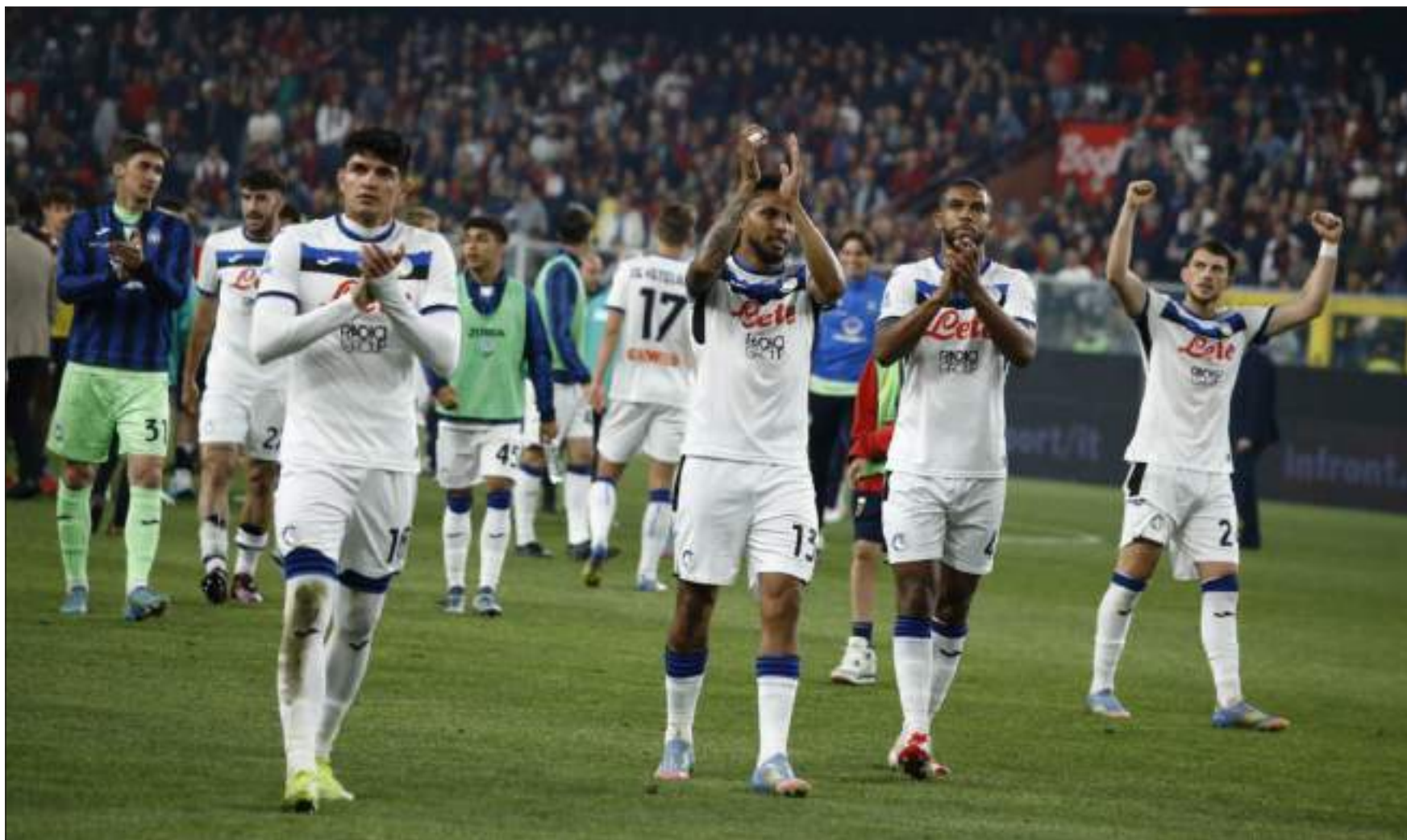
A CACCIA DELLA DECIMA VITTORIA CASALINGA - Dopo l'ennesima, ottima stagione l'Atalanta vuole battere il Parma per dare un'altra gioia ai propri tifosi

ter per lo scudetto, girone di ritorno con qualche inciampo e l'eliminazione prima dalla Coppa Italia e poi dalla Champions League. Dal punto di vista tattico e tecnico è stata un'Atalanta meno arretrante e aggressiva, più equilibrata nelle varie linee di gioco an-