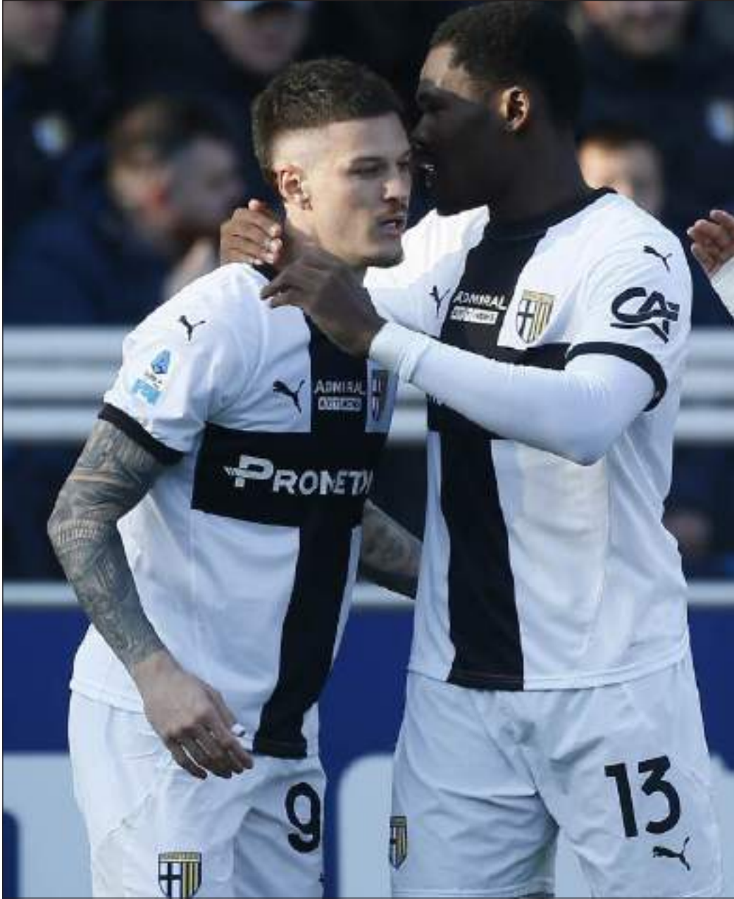
PROTAGONISTI DI QUESTO PARMA - Sopra, Man e Bonny esultano dopo un gol

Nel settembre 2020, il Parma Calcio è entrato ufficialmente nell'orbita americana con l'acquisizione da parte del Krause Group, holding statunitense guidata dall'imprenditore