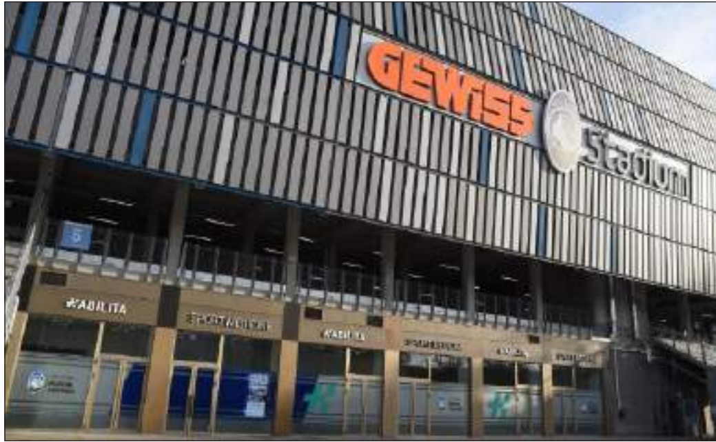
UN TEAM DI ESPERTI PROFESSIONISTI - Quello operativo all'Habilita Sport Medicine di Bergamo

Qual è l'aspetto fondamentale su cui punta la medicina dello sport?