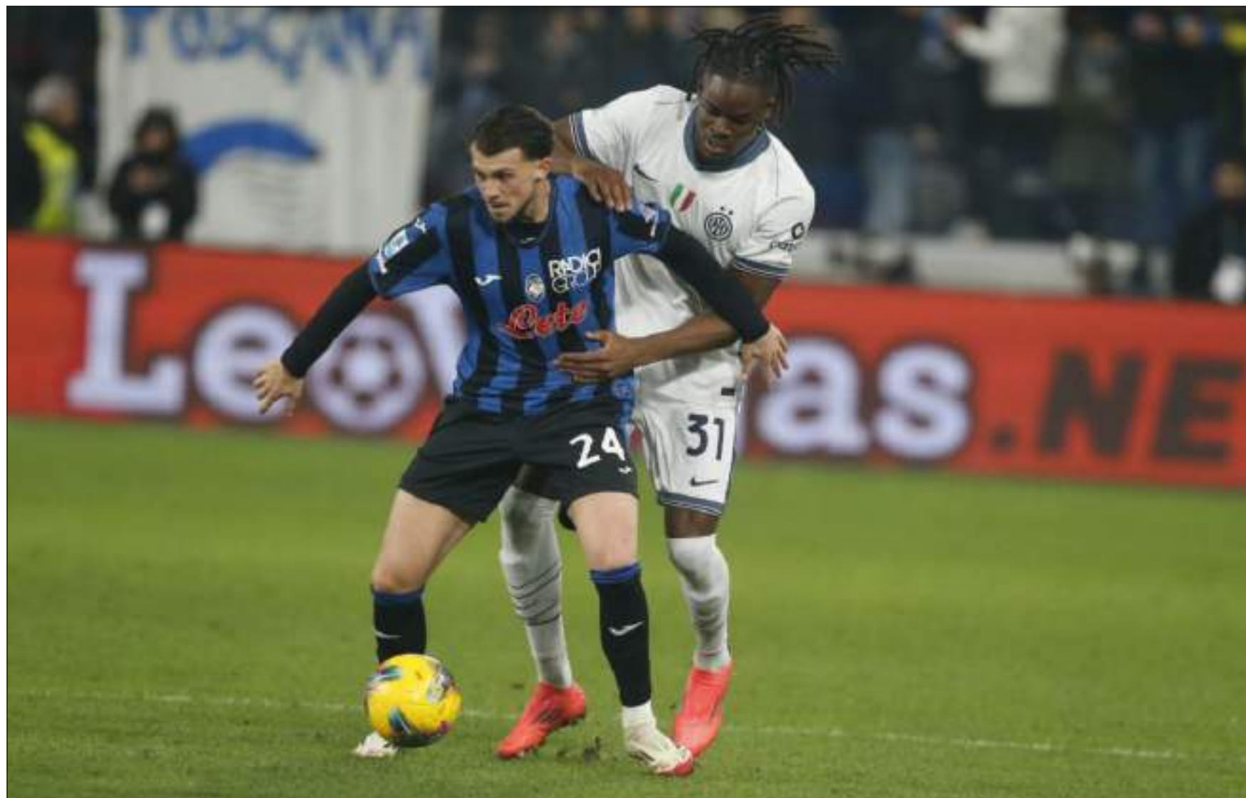
RISCATTO PIU' VICINO - Per Lazar Samardzic, approdato a inizio stagione all'Atalanta dopo tre anni stratosferici all'Udinese

Lazar Samardzic è arrivato a Bergamo il 18 agosto della scorsa estate con la formula di un prestito con opzione e obbligo di riscatto con una base di 5 milioni di euro, saldati subito dalla Dea, e un'opzione di rinnovo di 20 milioni di euro. Il centrocampista classe 2002 è arrivato dall'Udinese con l'etichetta di "giovane dal talento cristallino", viste le sue prestazioni nelle precedenti annate in Friuli: 3 stagioni condite da 98 presenze, 13 reti, 10 assist e giocate iconiche che gli hanno consentito di entrare nei radar di Napoli, Inter e altre squadre europee. Approdato all'Atalanta con grandi aspettative, il centrocampista serbo ha totalizzato 42 presenze in tutte le competizioni, la maggior parte delle quali da subentrato, in cui ha siglato 5 reti e fornito 3 assist. La sua è stata una stagione abbastanza opaca, in cui il suo talento ha brillato soltanto in pochissimi tratti: la strepitosa serpentina nella goleada contro lo Young Boys, le frecce contro Monza e Bologna e diverse giocate nel traffico di una stagione impegnativa su tutti i fronti. Sicuramente i preamboli erano diversi, ma a Bergamo è difficile emergere al primo anno, soprattutto in un reparto ricco di alternative come la trequarti nerazzurra. Le potenzialità non mancano, ma sicuramente servirà qualcosa in più per far sbocciare definitivamente il talento che ha questo ragazzo. Il minutaggio non è stato dalla sua parte, anche se ci sarà più di una motivazione dietro alle scelte di Gasperini.