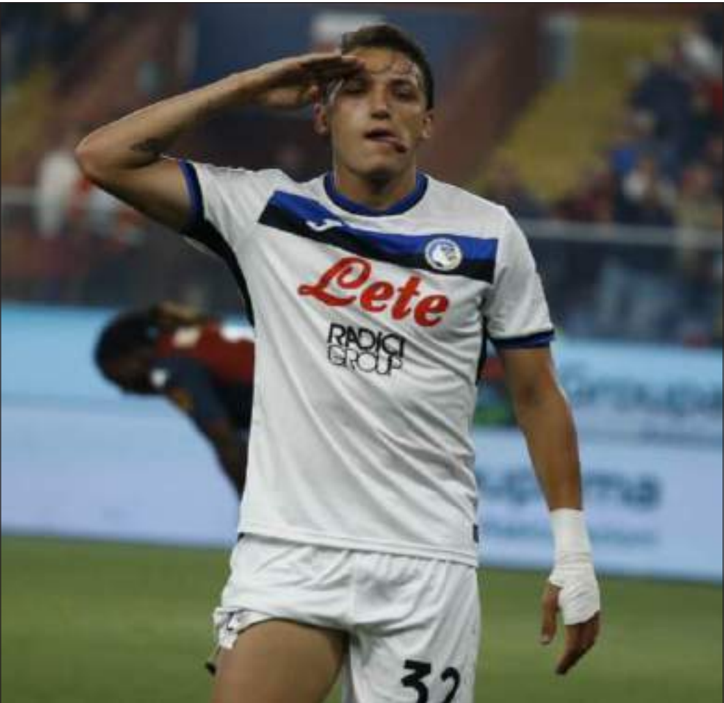
L'UOMO DEI RECORD - Mateo Retegui, 25 gol in questo campionato

SERIE A Oggi alle 20.45 contro il Parma per chiudere nel migliore dei modi la stagione 2024-2025