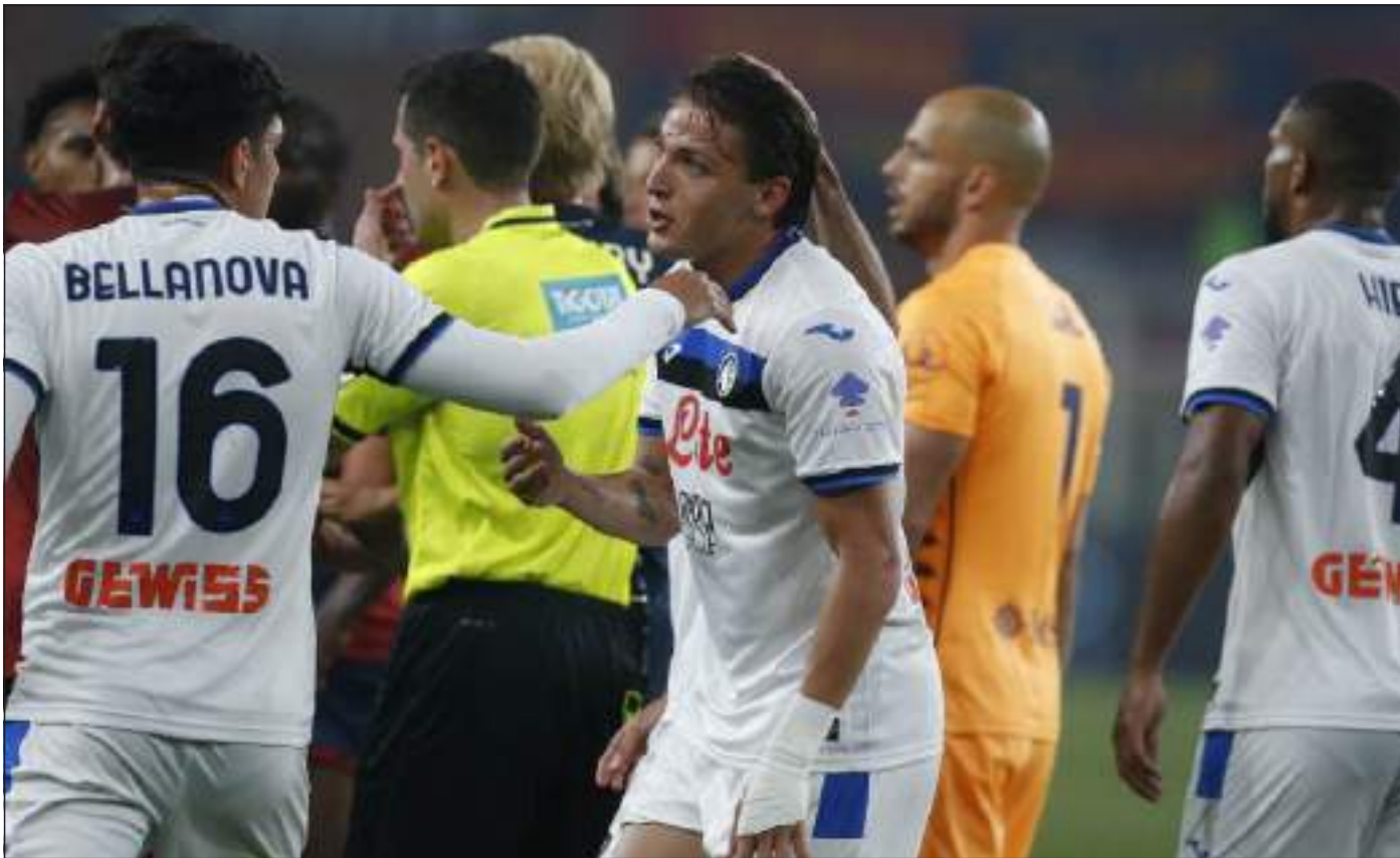
LA CERTEZZA - Anche nella vittoria di Genova la rete decisiva è stata firmata dal «solito» Mateo Retegui

Acquisti da equivoco tattico, si direbbe, mentre il figlio d'arte alla fine la svegliata se l'è data rendendosi finalmente utile per acciuffare lo score una seconda volta al cospetto di una squadra senza ormai motivazioni, orgoglio a parte.